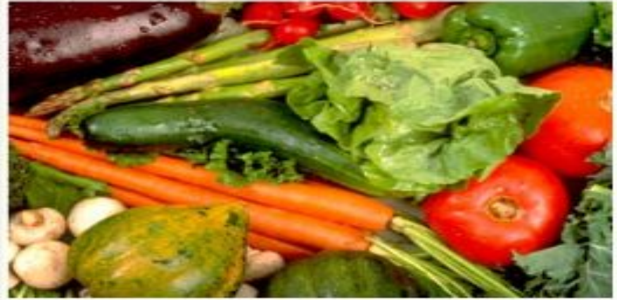
Мойте овощи и фрукты