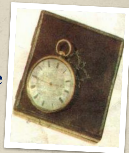
Карманные часы поэта