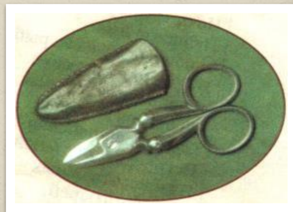
Ножницы и кожаный футляр