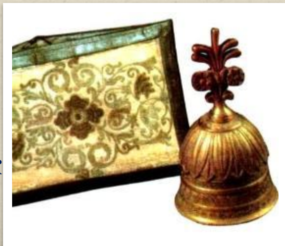
Бумажник и бронзовый колокольчик