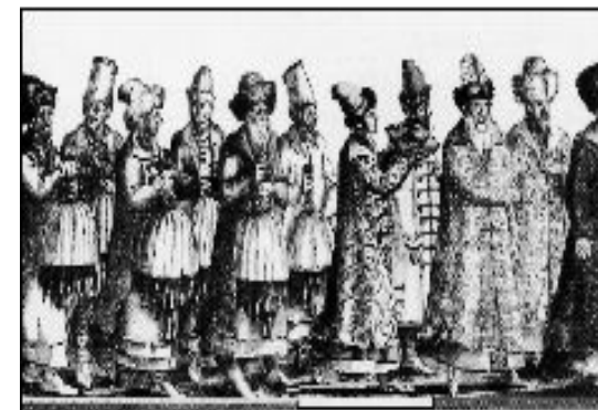
Русские купцы со связками пушнины в составе посольства. С немецкой гравюры XVI в.