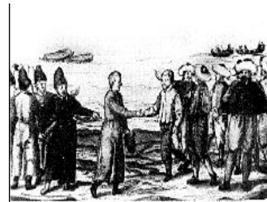
Торговля между русскими и голландцами на Севере.