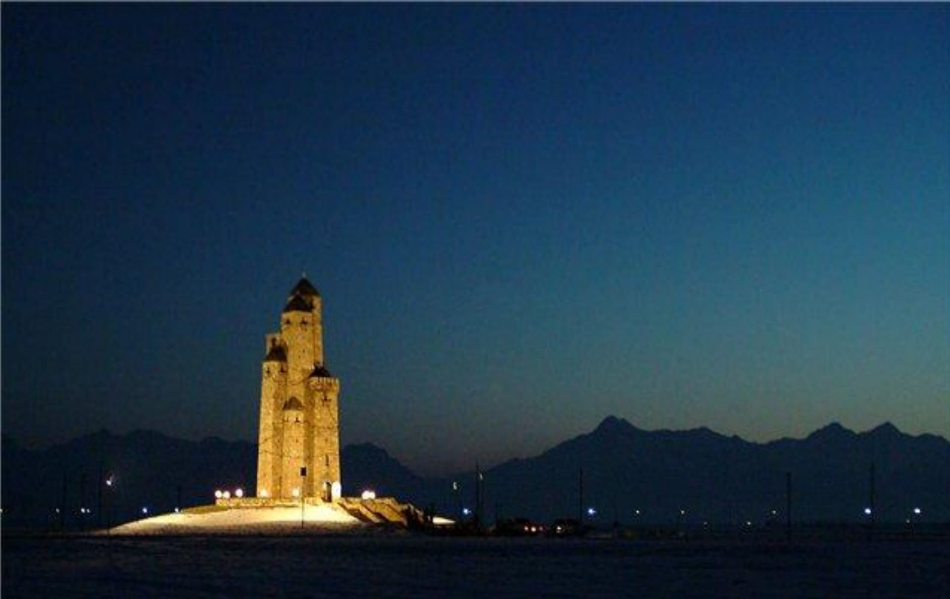
Памятник жертвам репрессий. г.Назрань.