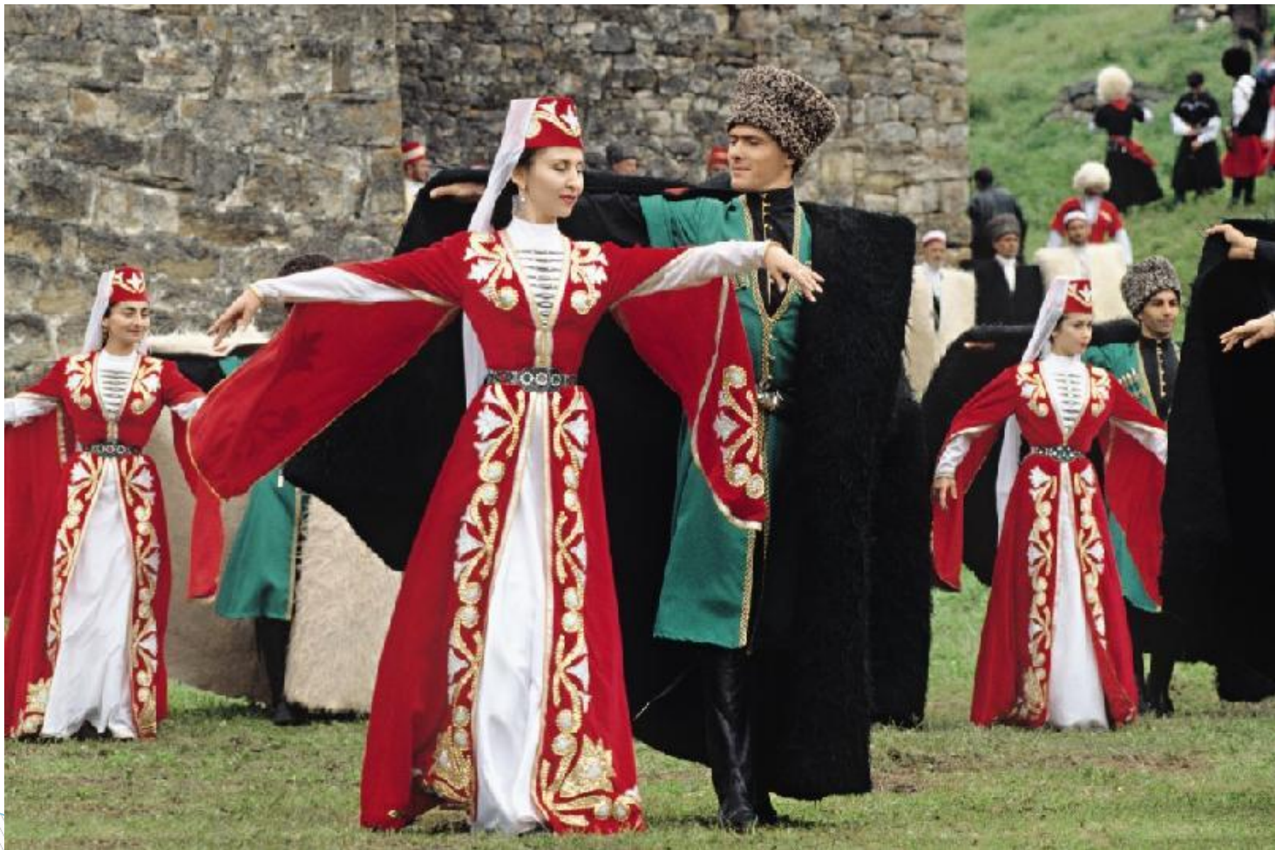
Национальная одежда ингушей