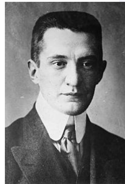
А. Ф. Керенский

В состав второго коалиционного правительства вошли: Министр-председатель и военный и морской министр — А. Ф. Керенский; заместитель Министра-председателя и министр финансов — Н. В. Некрасов; министр внутренних дел — эсер Н. Д. Авксентьев; министр иностранных дел — М. И. Терещенко; министр юстиции — А. С. Зарудный; министр народного просвещения — С. Ф. Ольденбург; министр торговли и промышленности — С. Н. Прокопович; министр земледелия — В. М. Чернов; министр почт и телеграфов — А. М. Никитин; министр труда — М. И. Скобелев; министр продовольствия — А. В. Пешехонов; министр государственного призрения — И. Н. Ефремов; министр путей сообщения — П. П. Юренев; обер-прокурор Святейшего Синода — А. В. Карташёв; государственный контролёр — Ф. Ф. Кокошкин.