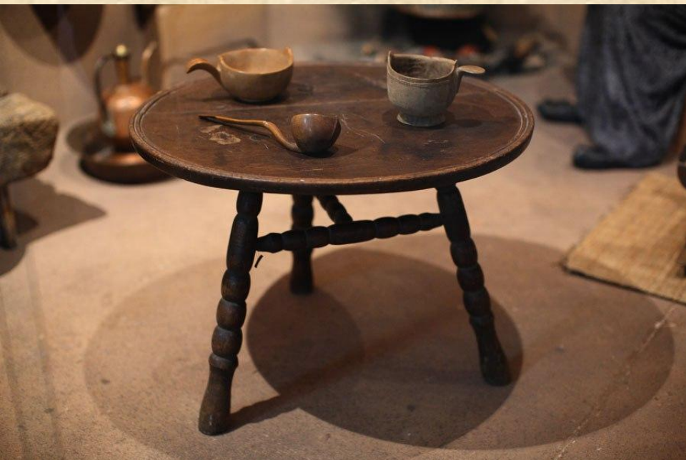
Черкесский трехногий столик