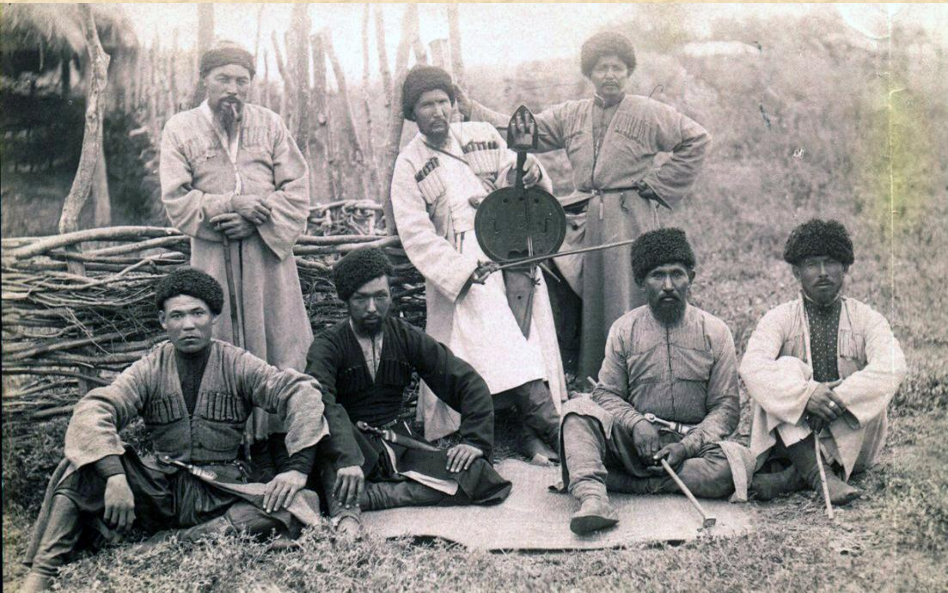
Кубанские ногайцы из Мансуровского аула