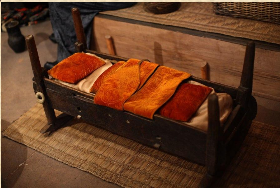
Черкесская детская люлька