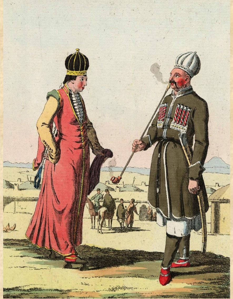
Черкешенка-княжна и знатный черкес