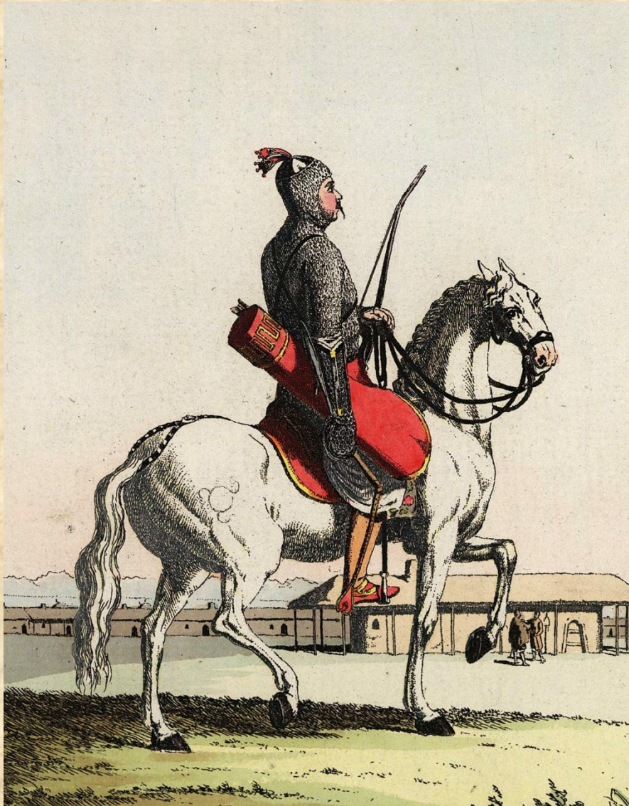
Знатный черкесский воин