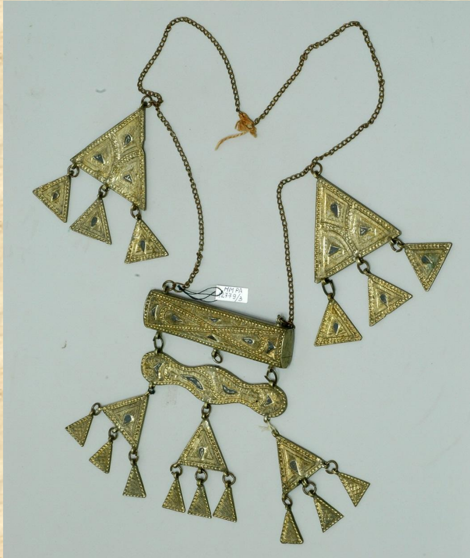
Женское украшение- амулетница

Золото в качестве украшения не использовали, предпочитали серебро , которое иногда чернили или покрывали позолотой: женские наборы (нагрудник и пояс), рукоятки кинжалов и шашек, мужские пояса, конская упряжь и др.