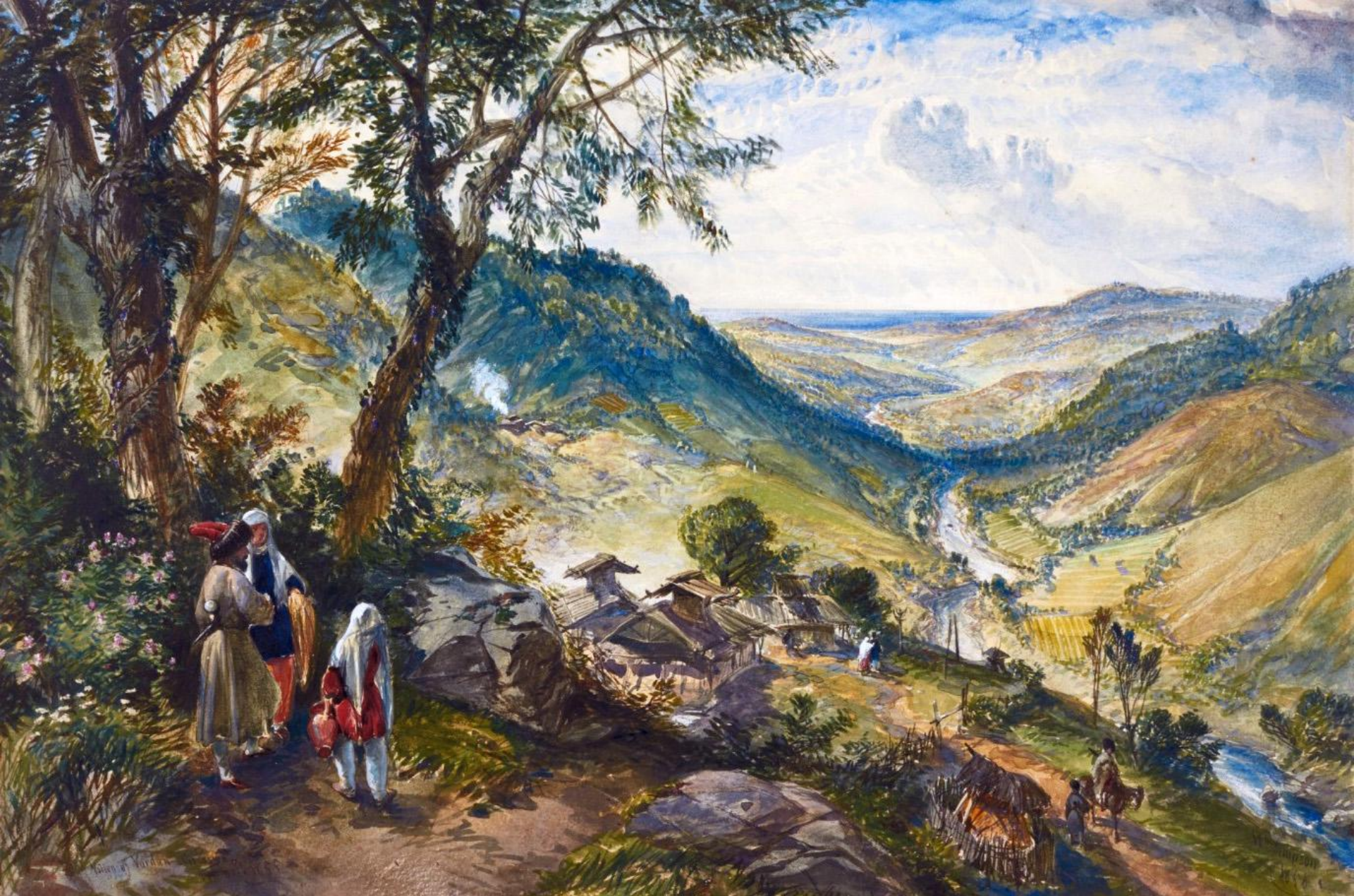
Художник Уильям Симпсон «Долина реки Вардане. 19 октября 1855 года» (территория племени убыхов, район Сочи)