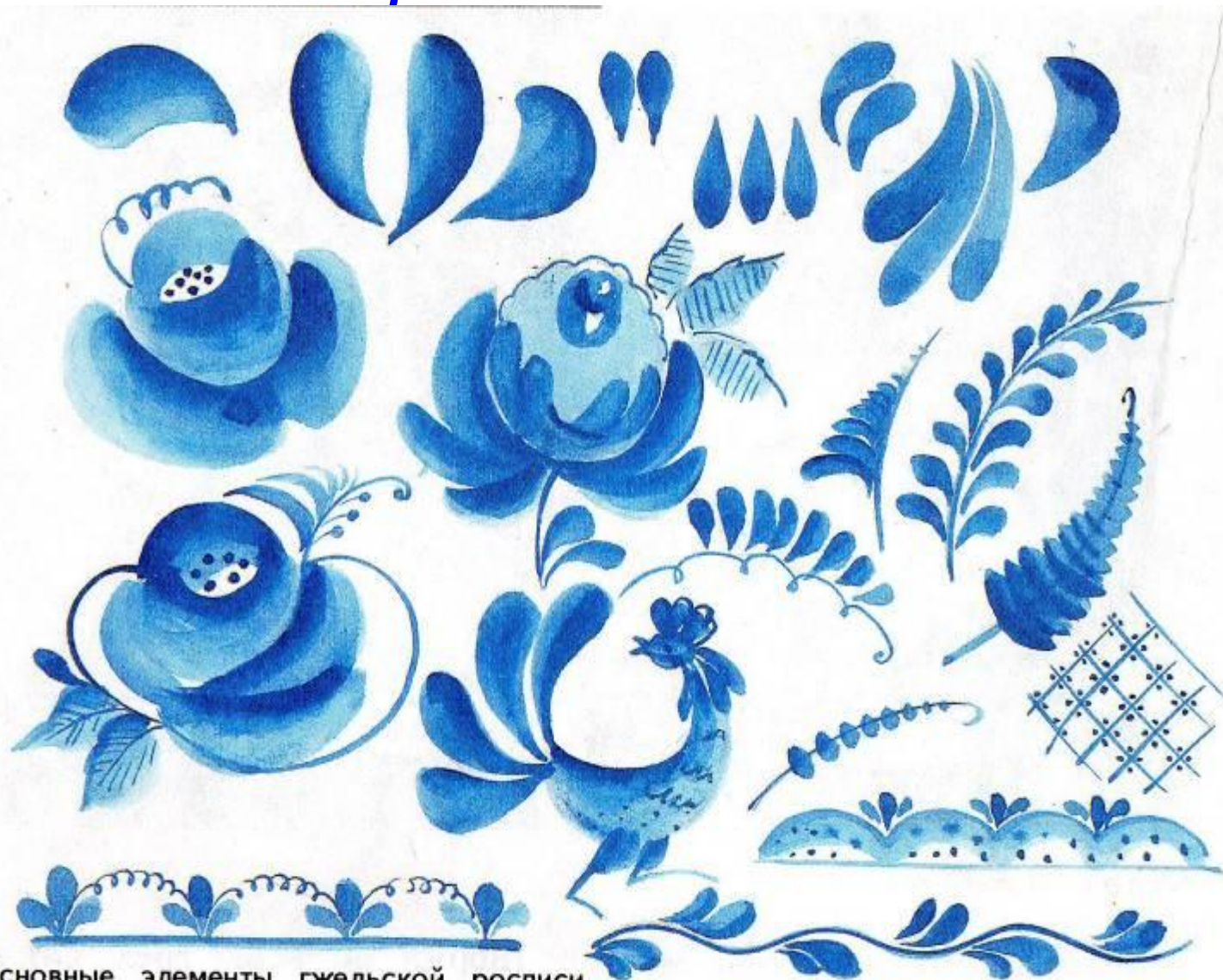
Основные элементы гжельской росписи