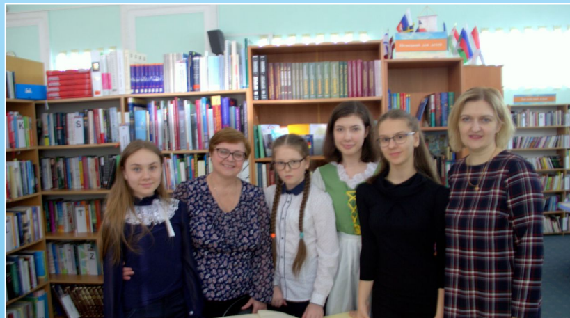
Победители конкурса чтецов на немецком языке