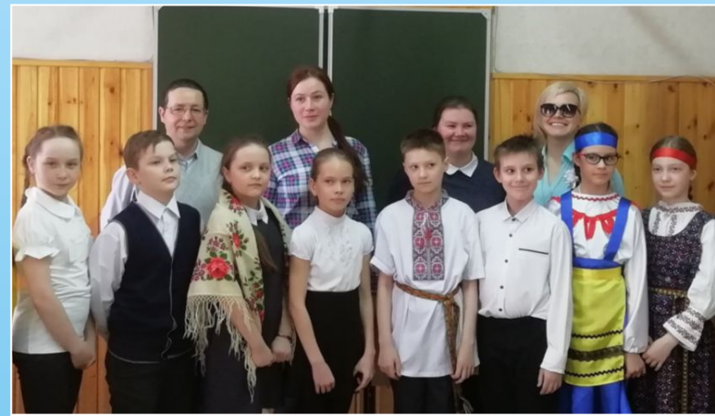
Участники конкурса чтецов на коми языке