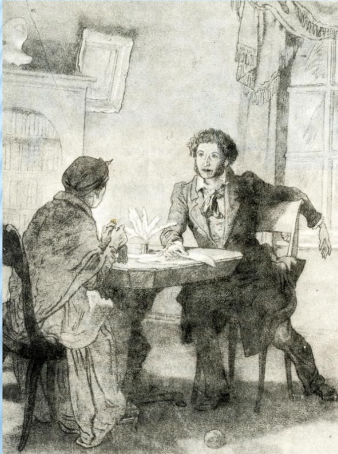
Иллюстрация к стихотворению «Зимний вечер»

Забота и любовь Арины Родионовны скрашивали поэту ссылку. Пушкин по-настоящему крепко любил свою няню и написал несколько трогательных стихотворений, к ней обращенных.