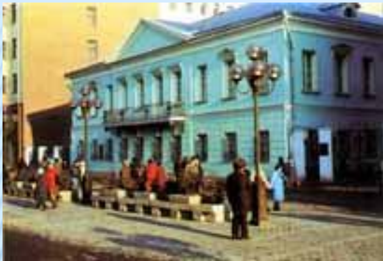
Квартира Пушкина в Москве на Арбате

18 февраля 1831 г. в церкви Вознесения Господня состоялось его венчание с Н. Н.Гончаровой. Первые месяцы семейной жизни он провел с женой в Москве, сняв квартиру на Арбате