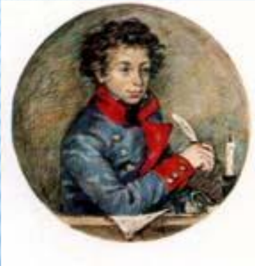
Саша Пушкин, лицеист. Художник Ю. В.Иванов.