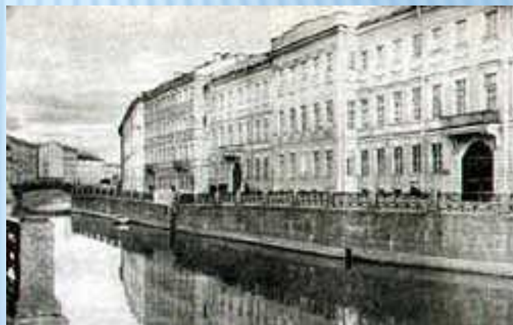
Квартира Пушкина в Петербурге на Набережной Мойки

С середины октября 1831 г. и уже до конца жизни Пушкин с семьей живет в Петербурге.