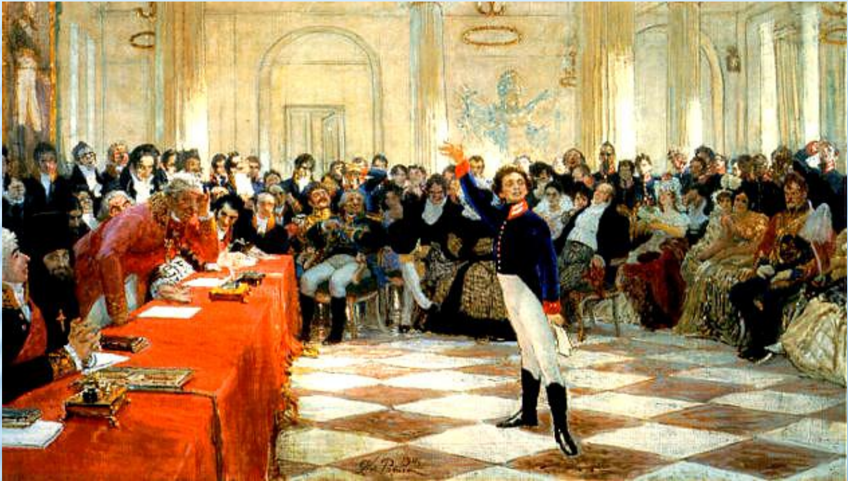
"Пушкин в Царском Селе", картина Ильи Репина, 1911.