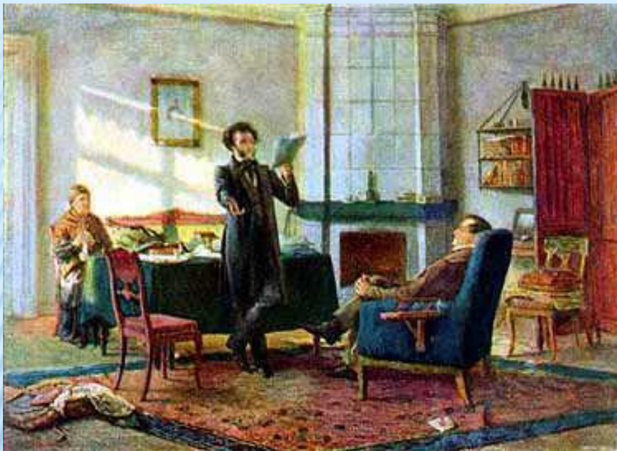
Пушкин в селе Михайловском (Пуцин у Пушкина). Художник Н.Н. Ге. 1875 г.