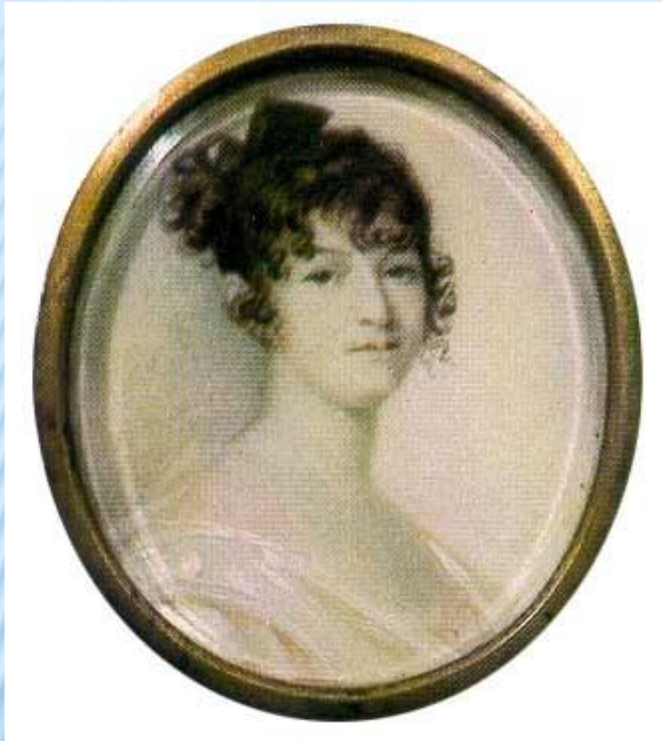
Н.О. Пушкина. 1800-е гг.

Мать, Надежда Осиповна , приходилась внучкой арану Петра I, впоследствии русскому генералу Ганнибалу.