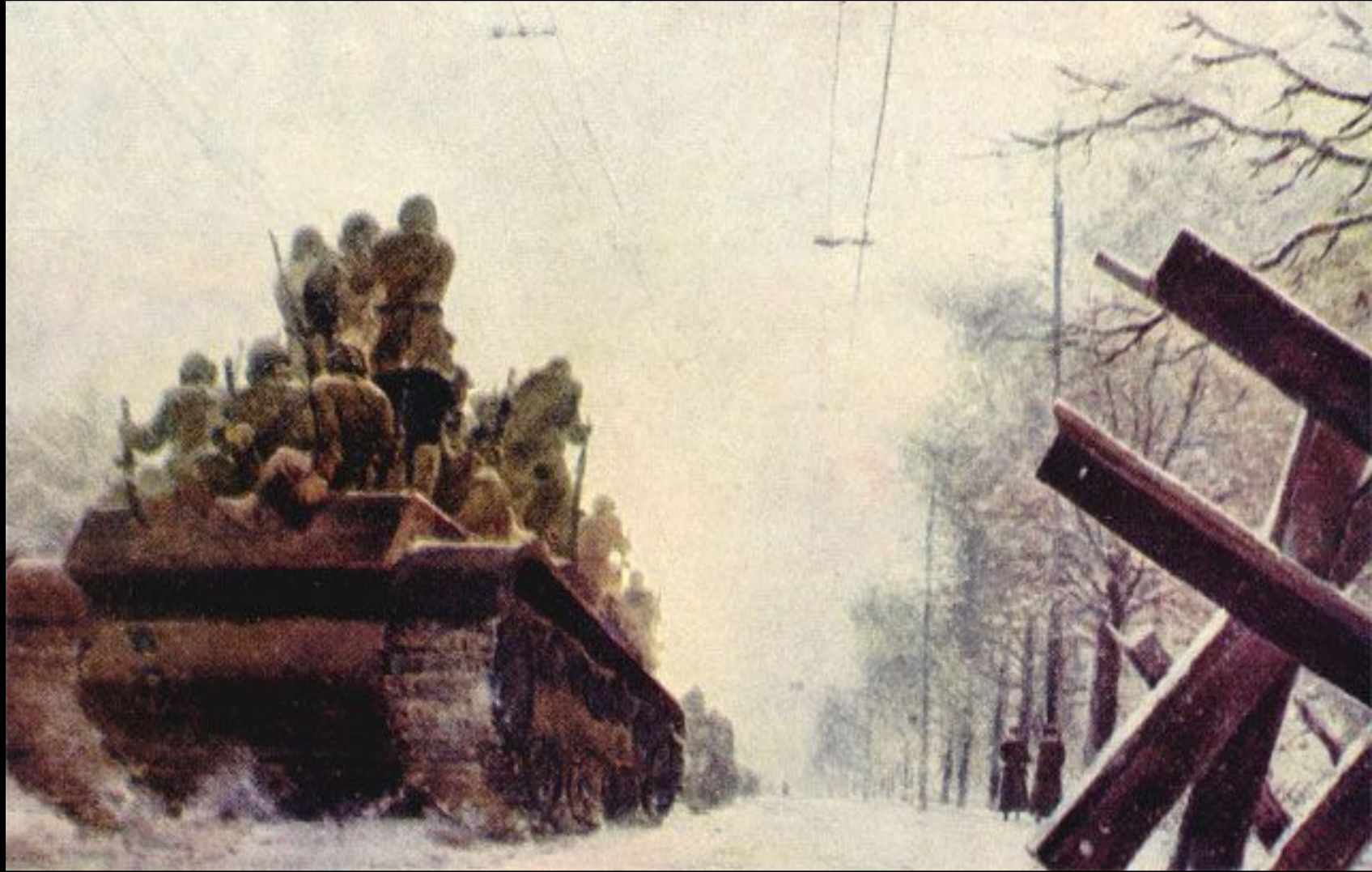
Л. В. Сойфертис «Севастополь»