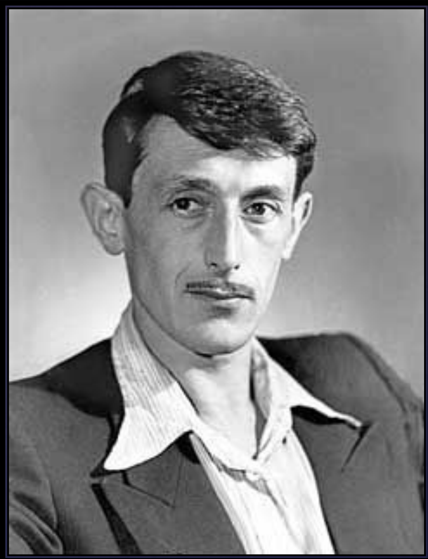
Некрасов Виктор Платонович «В окопах сталинграда»