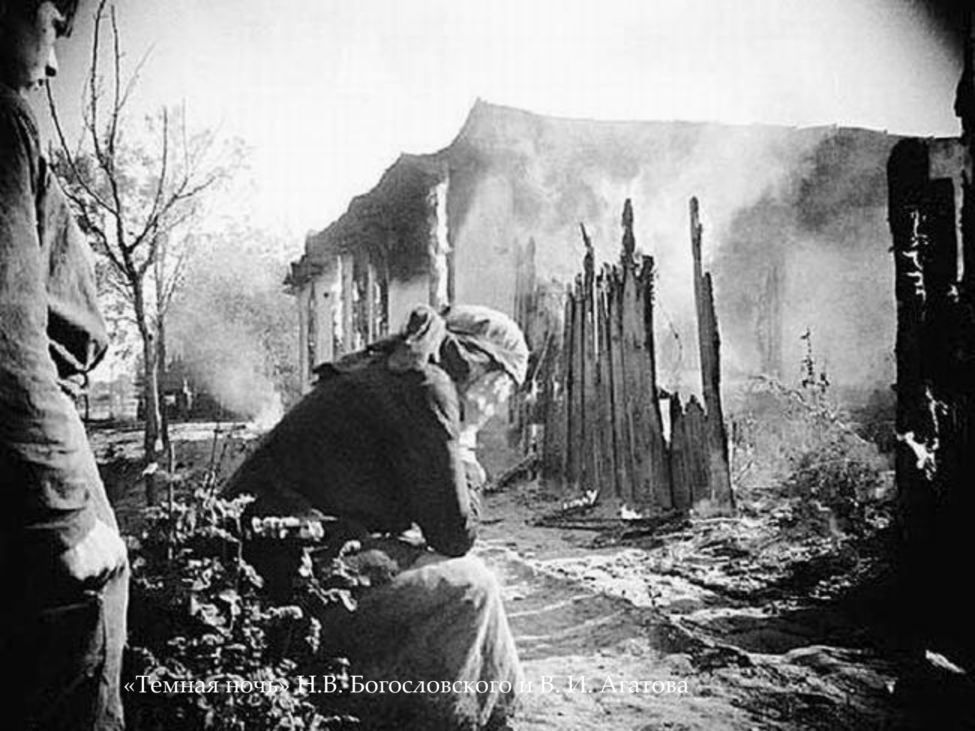
«Темная ночь» Н.В. Богословского и В. И. Агатова