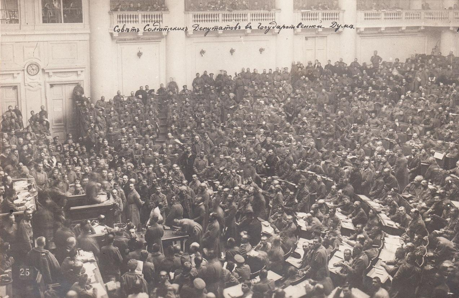
Совет солдатских депутатов в зале заседаний Государственной Думы в Таврическом дворце