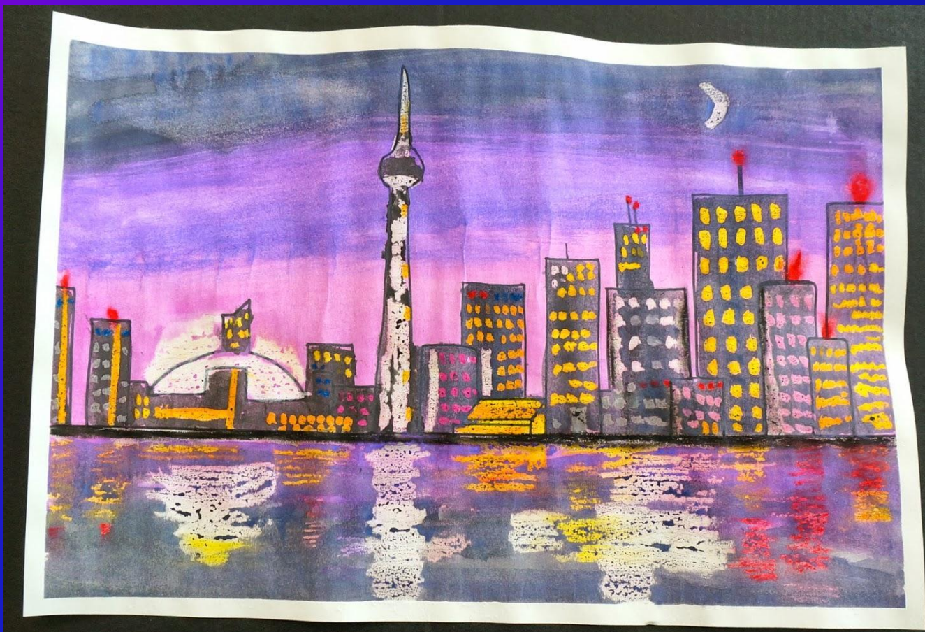
Рисуем ночной город