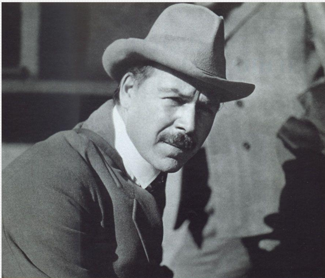
Н.И. Вавилов. Рим. 1927 г.