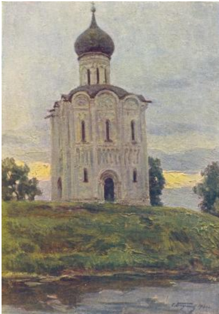
С.А. Баулин. «Храм Покрова на Нерли»