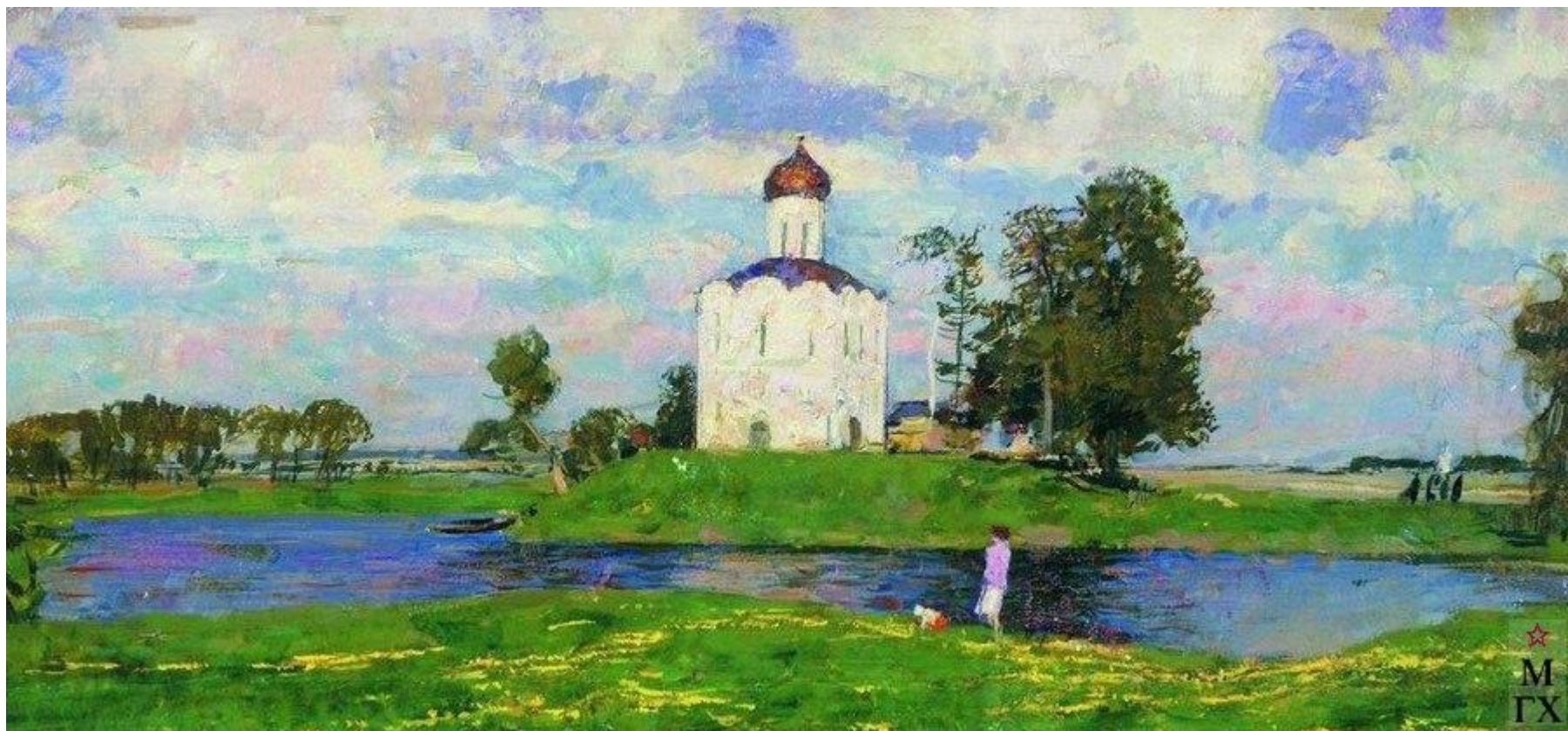
С.В. Герасимов «Церковь Покрова на Нерли»