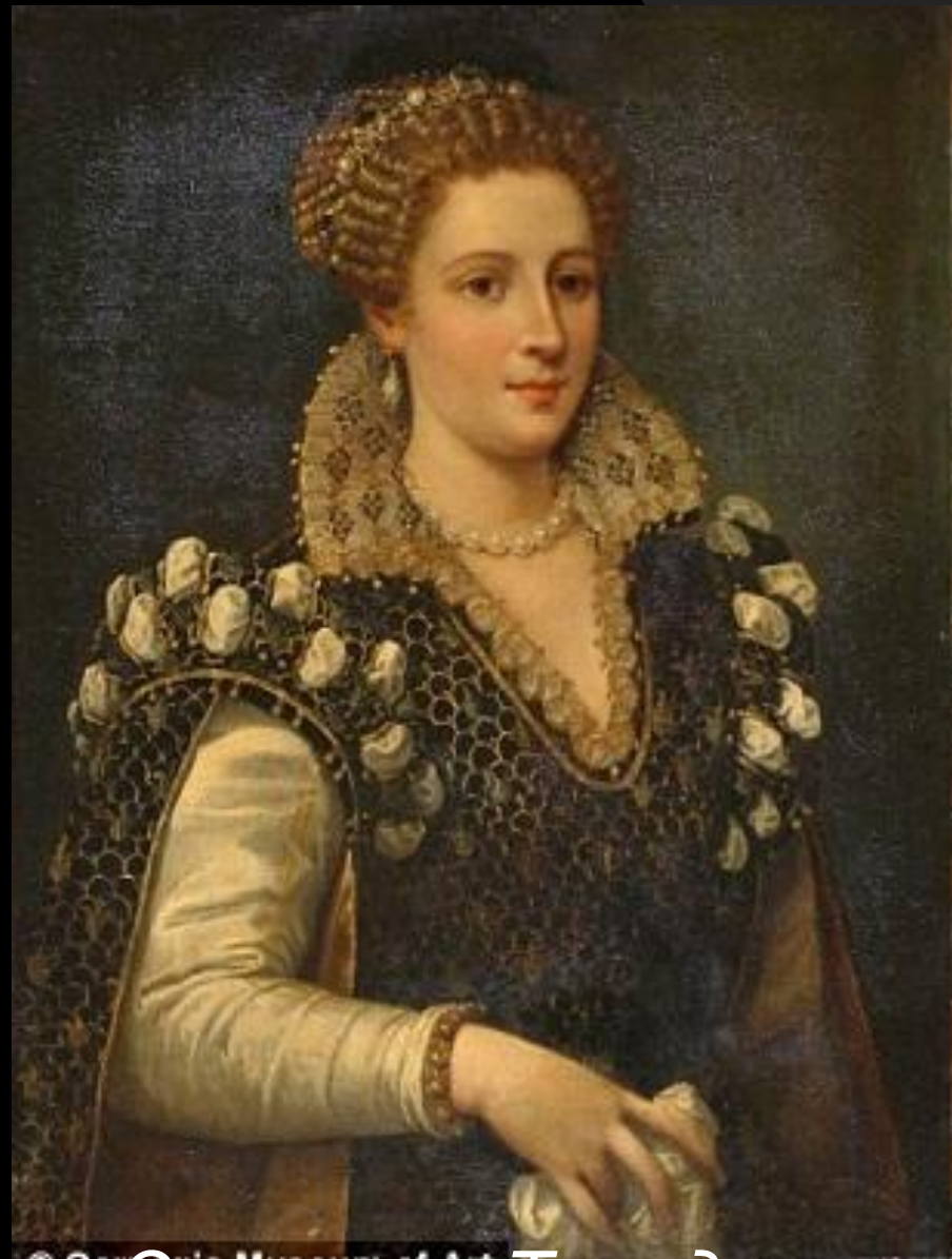
Элеонора Толедская Медичи.