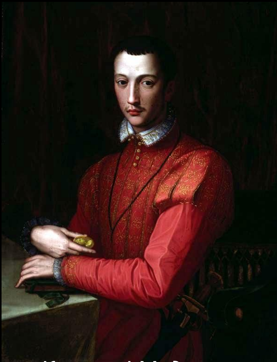
Казимо I Медичи.