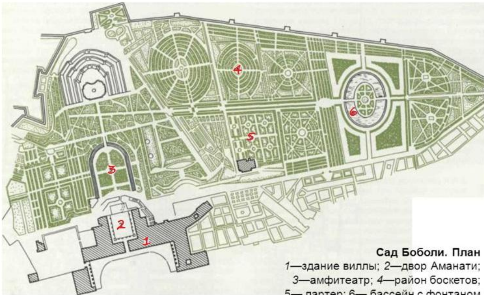
Сад Боболи. План