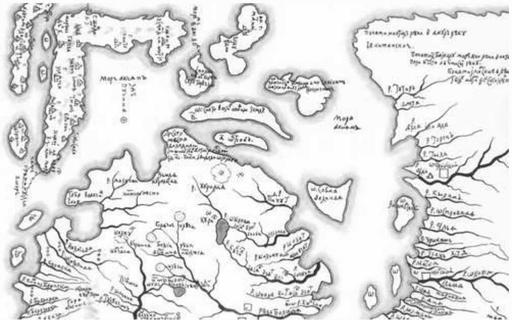
Чертеж Камчадалской земли и моря С. Ремезова

Этот остров был настолько мал, что составители следующего «Чертежа всея Сибири» 1673 года забыли о его существовании. На данном чертеже ни в амурском устье, ни вблизи него вообще нет какого-либо острова.