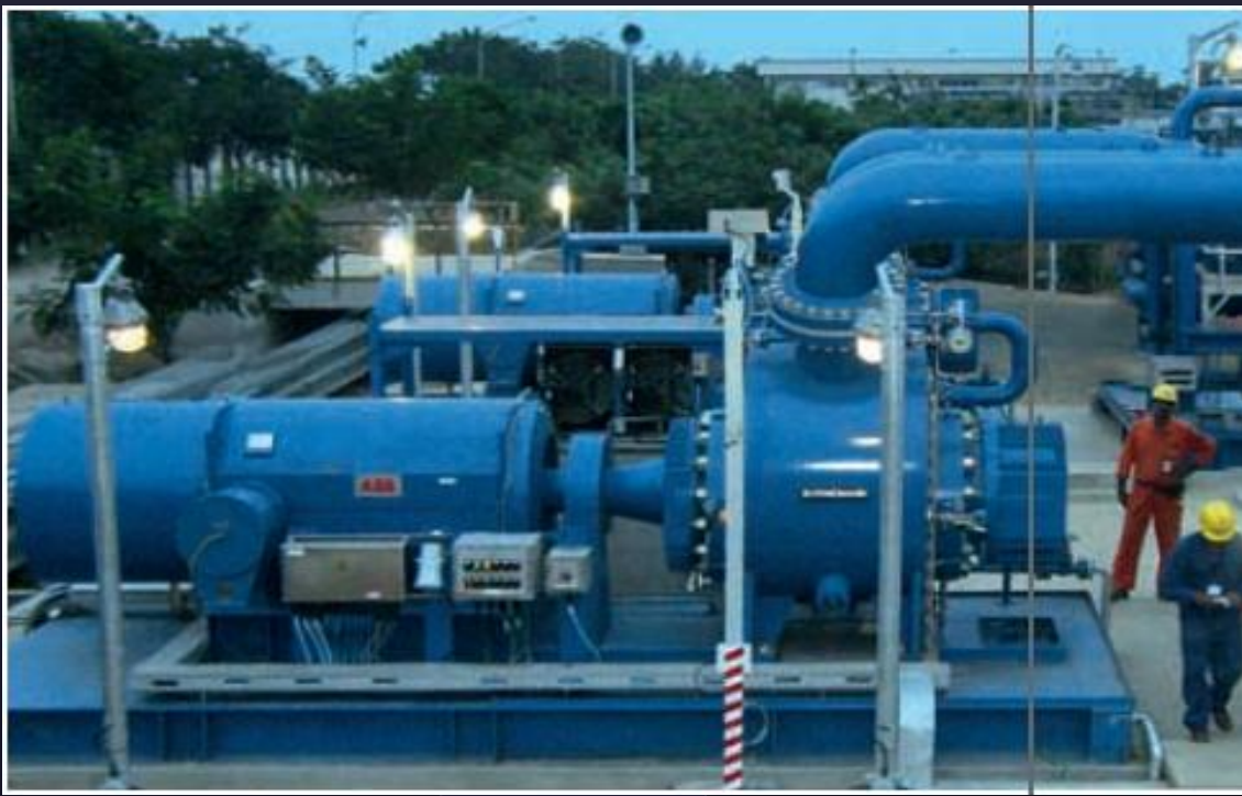
ЭВН установка электро-винтового насоса (УЭВН)