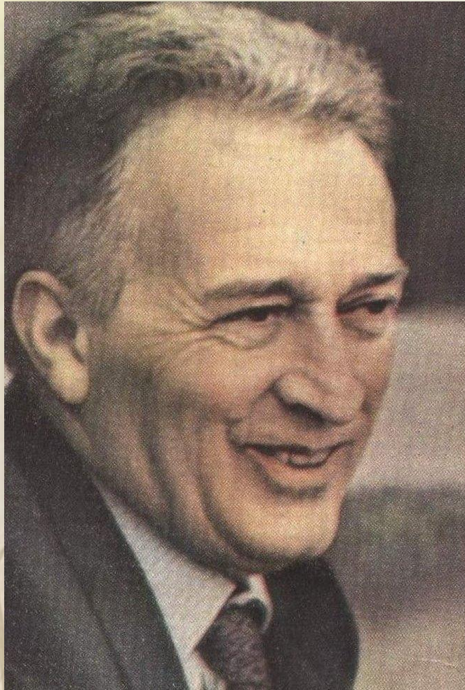
Джанни Родари 1920-1980