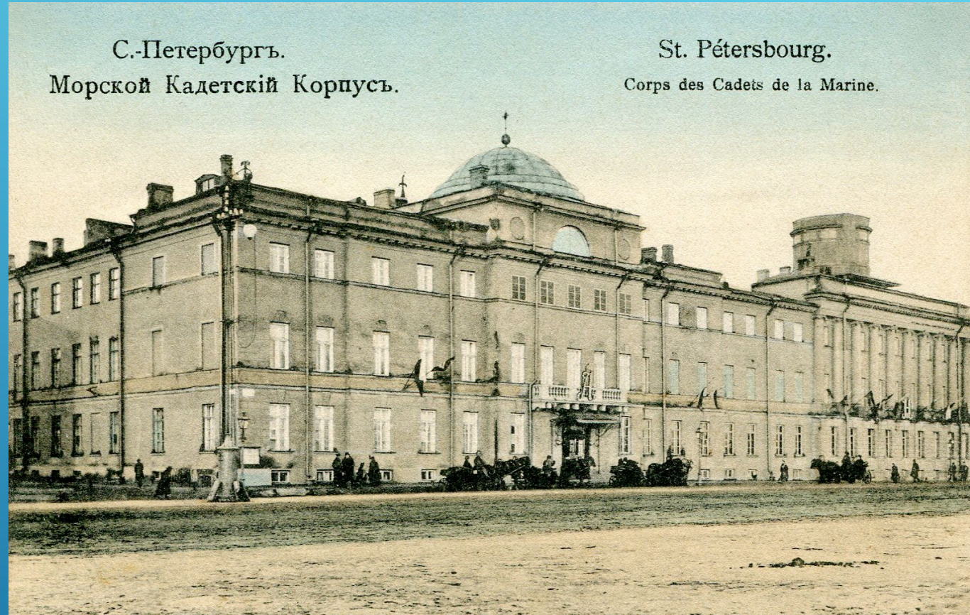
С.-Петербургъ. Морской Кадетскій Корпусъ.

В 1835 году, в 16 лет, он с отличием окончил Морской кадетский корпус в Петербурге и, получив чин мичмана, пошел служить во флот. Выбрав специальностью морскую артиллерию, Посьет в 1837-1841 годах служил в составе флота в Белом и Балтийском морях, вел гидрографические работы в Финском заливе.