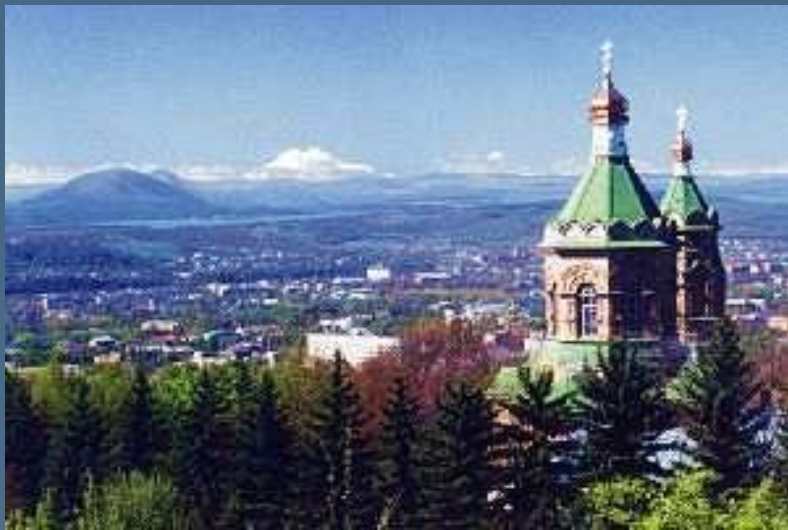
Вид на Пятигорск, который раньше называли Горячеводском.

Для укрепления Мишенькиного здоровья летом 1825 года бабушка повезла его в Горячеводск