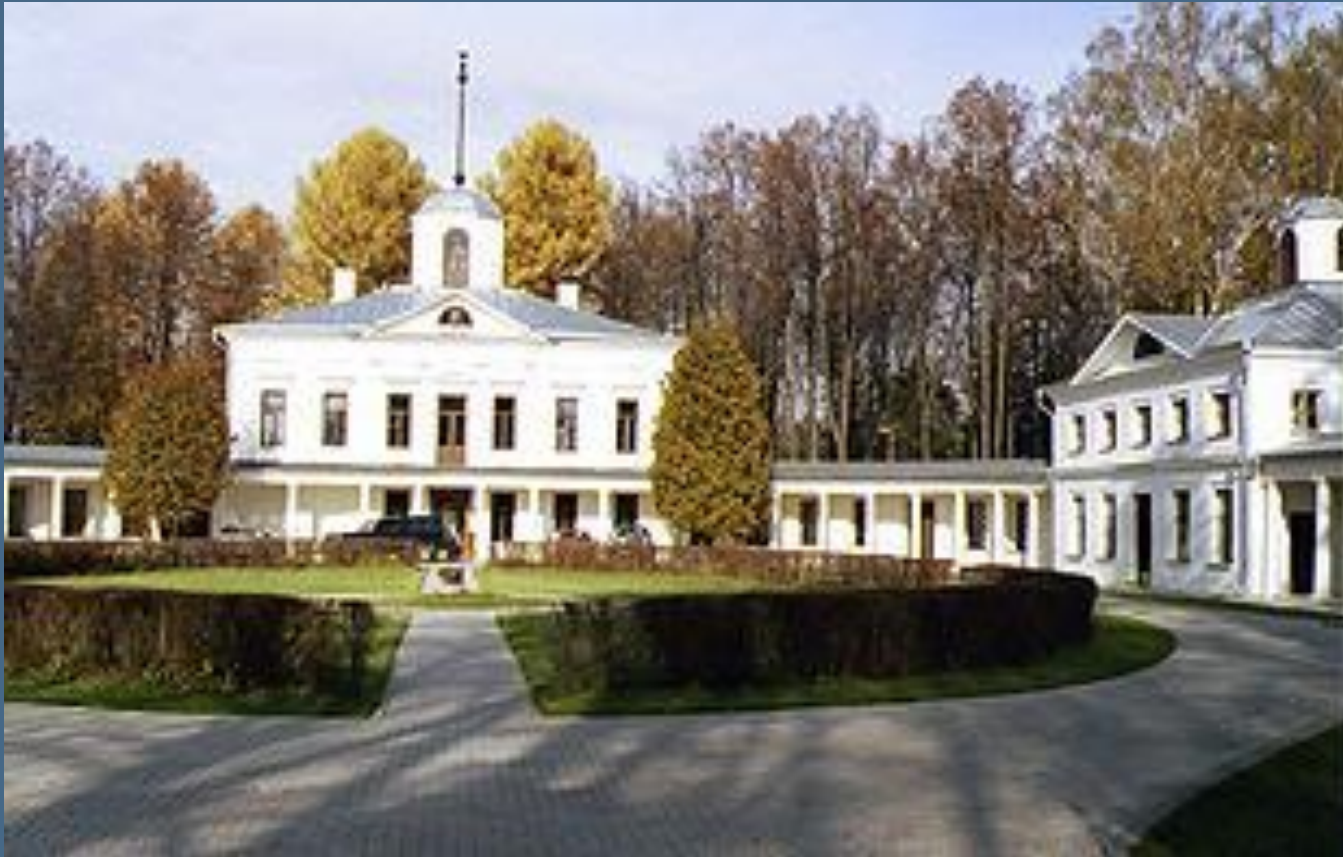
Усадьба в Середникове.

В Середникове Лермонтов работал над двумя драмами «Испанцы» и «Люди и страсти», а также над второй редакцией «Демона», «Каллы», «Джюлио», «Последний сын вольности» и «Исповедь». В 1830 году Лермонтов создал более ста стихотворений, среди них и стихотворение «Бородино».