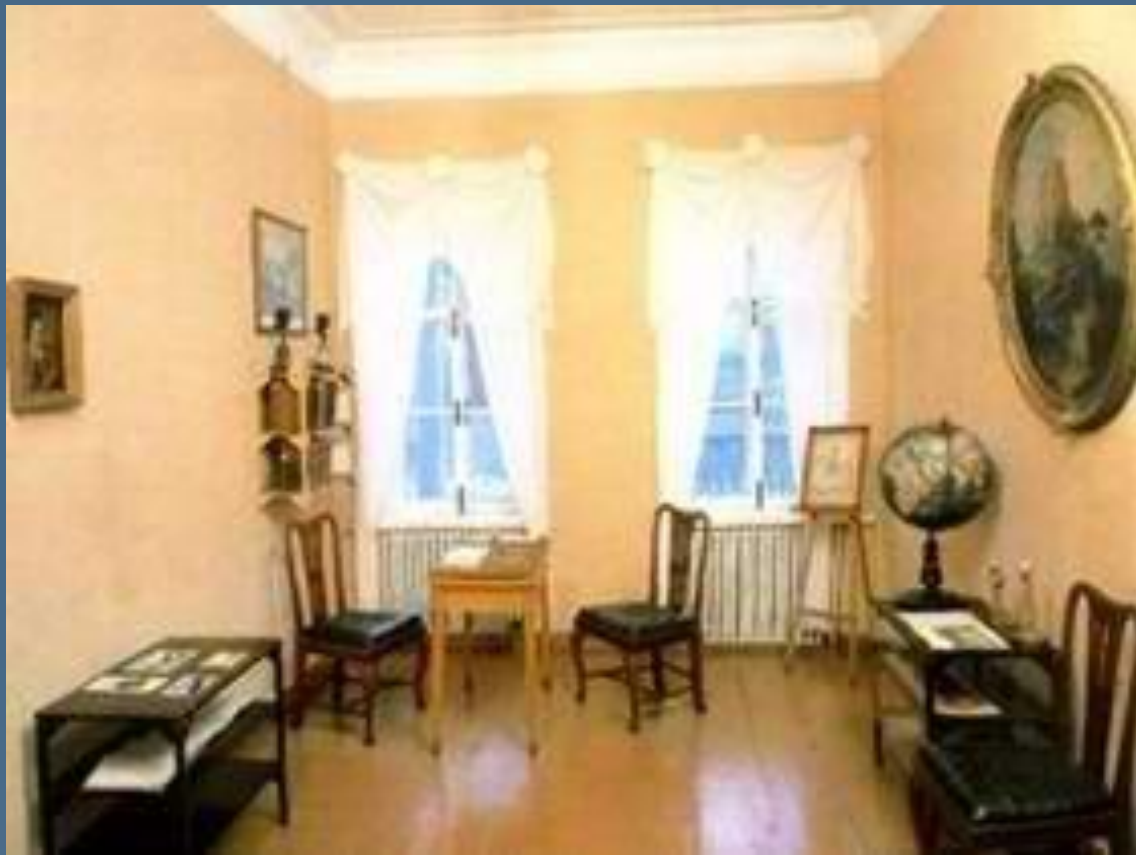
Классная комната, где учителя занимались с Лермонтовым.

С детства Лермонтов владел французским и немецким языками так же свободно, как и русским, изучал историю, географию, математику, словесность, выучился играть на скрипке и фортепьяно.