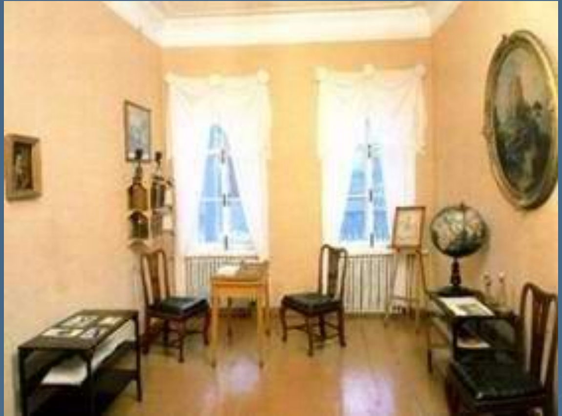
Классная комната, где учителя занимались с Лермонтовым.

С детства Лермонтов владел французским и немецким языками так же свободно, как и русским, изучал историю, географию, математику, словесность, выучился играть на скрипке и фортепьяно.