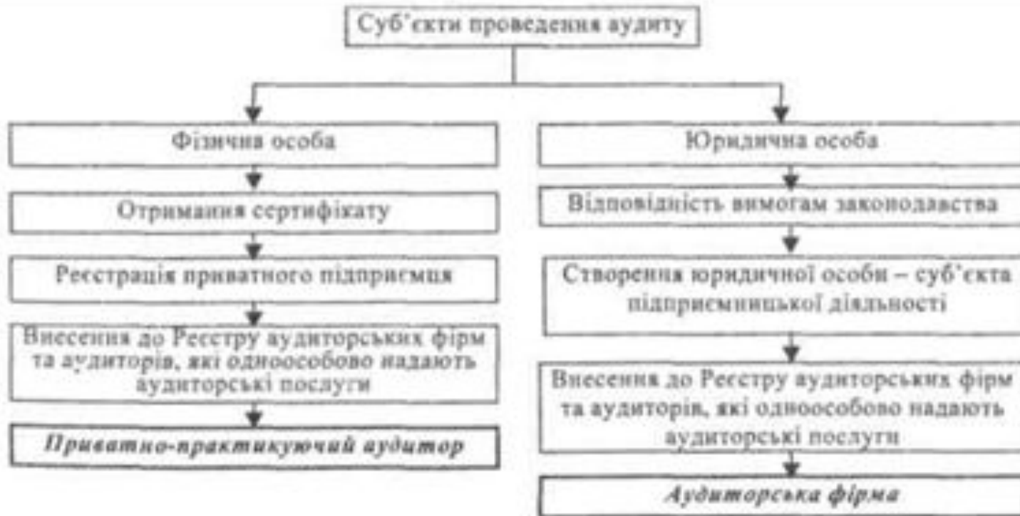
Рис. 5.1. Суб'єкти проведення аудиту

Суб'єктами проведення аудиту виступають аудиторські фірми, приватно-практикуючі аудитори, які здійснюють аудиторську діяльність в Україні згідно з чинним законодавством