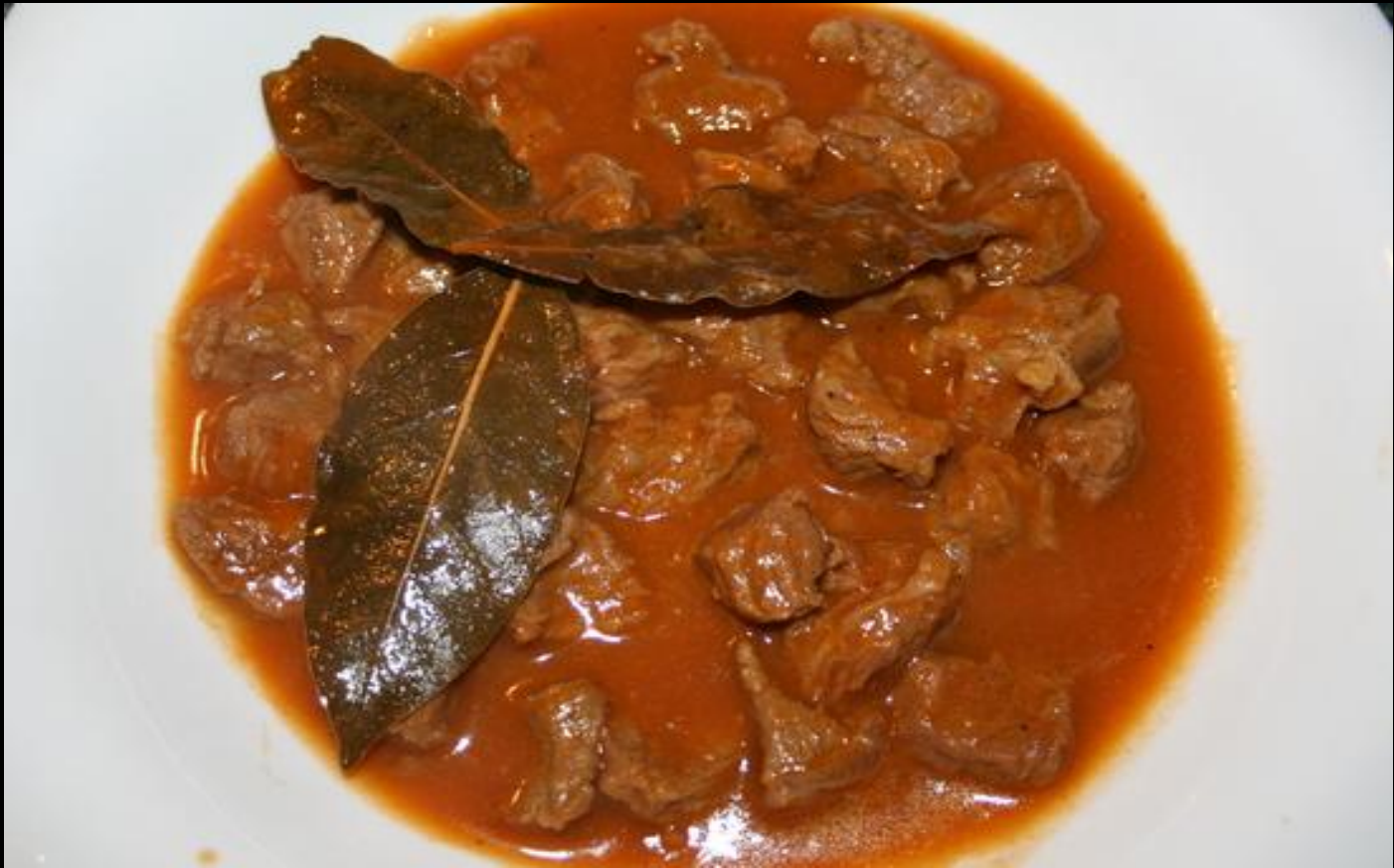
Гуляш из говядины