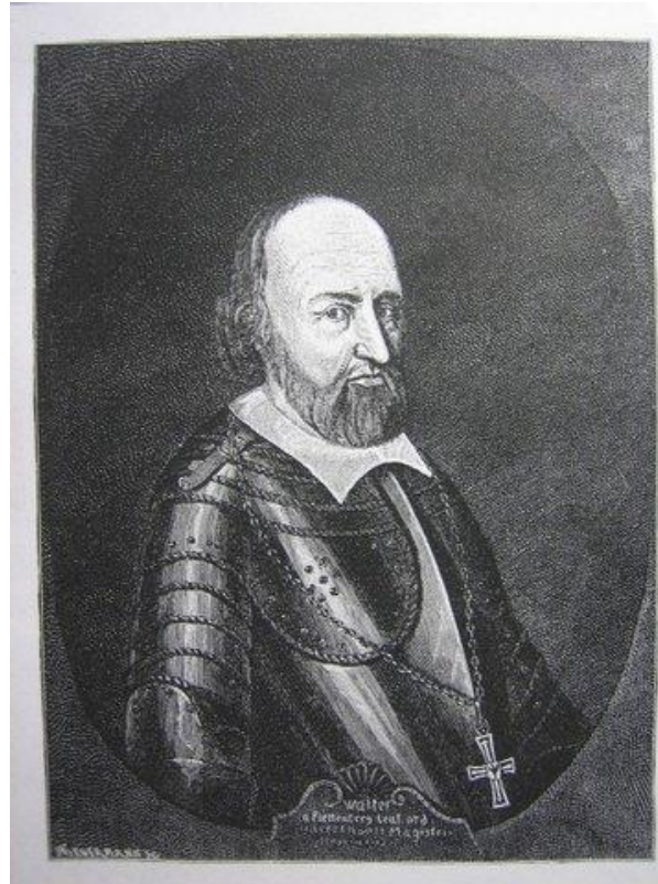
Вальтер фон Плеттенберг