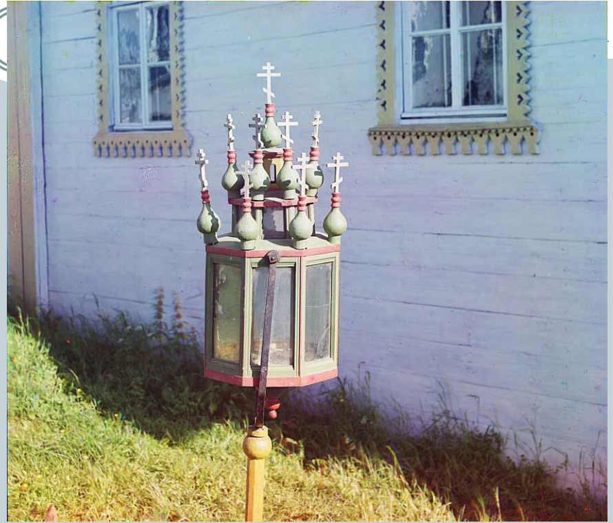
Старинный фонарь в церкви Успения Божией Матери.