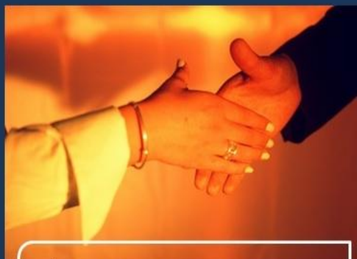
Размещение менеджерами заказа на фабрике