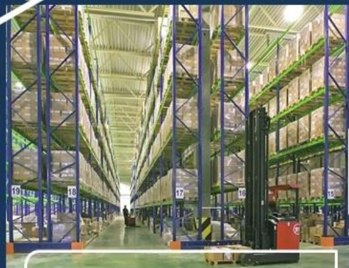
ДОСТАВКА ; СКЛАД, ЕКАТЕРИНБУРГ (ЛОГОПАРК-Пышма)