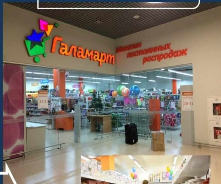
Реализация товара через розничную сеть Галамарт