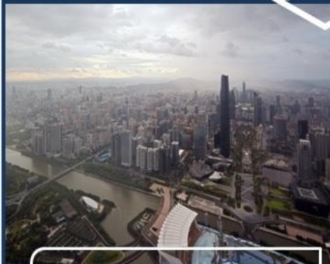
Производство под контролем качества