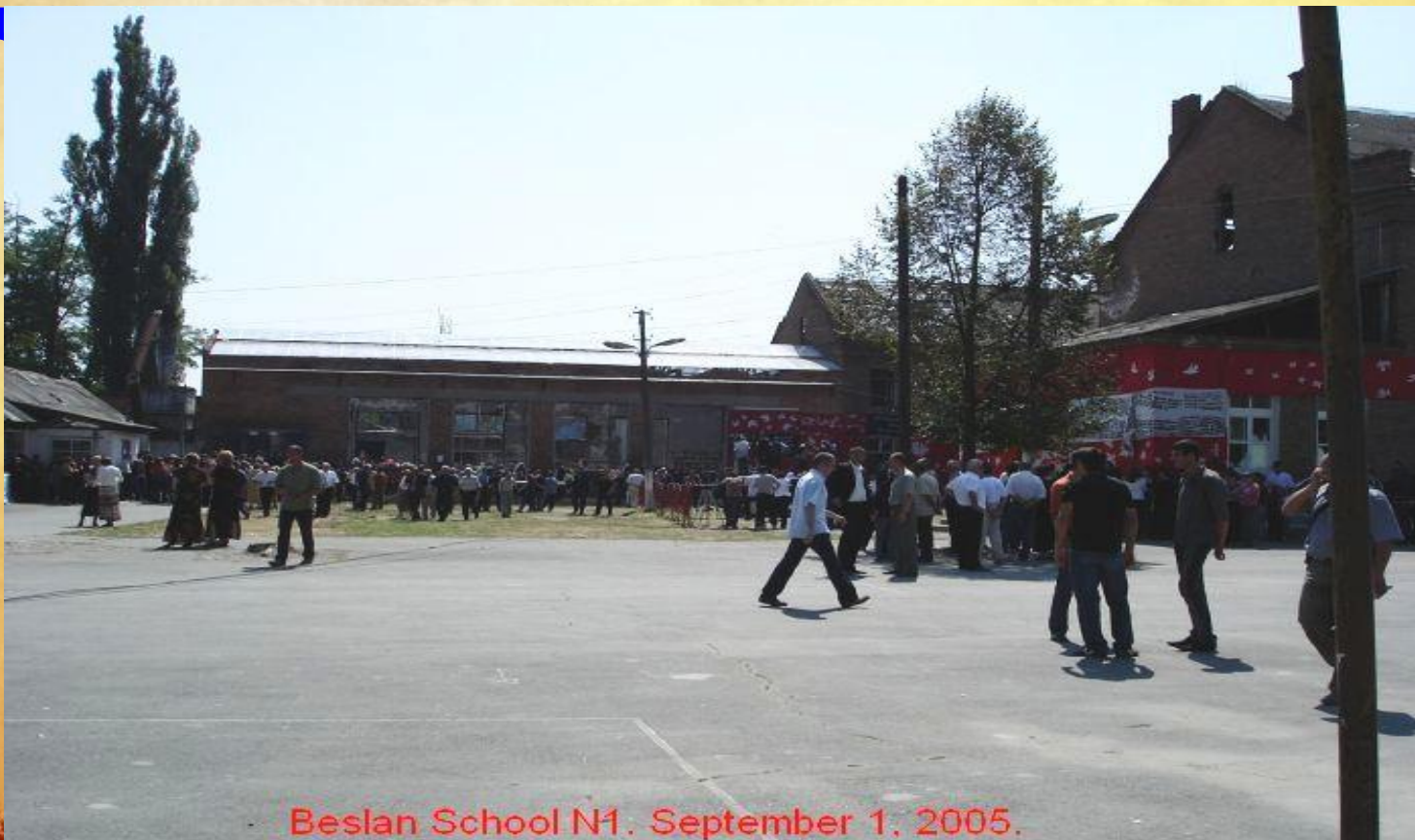
Beslan School N1. September 1, 2005.

10.50 – вокруг школы выставляется оцепление из бойцов внутренних войск, милиции и спецназа. К кольцу оцепления собираются род