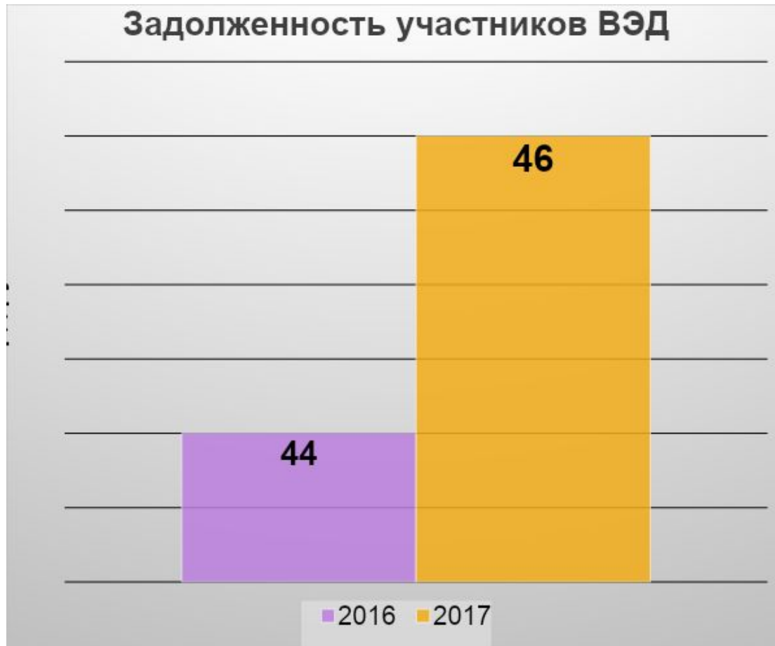
Задолженность участников ВЭД

За 2016 г. и первое полугодие 2017 г. таможенные органы по результатам таможенного контроля доначислили около 38 млрд рублей , но взыскали около 75% от данной суммы.