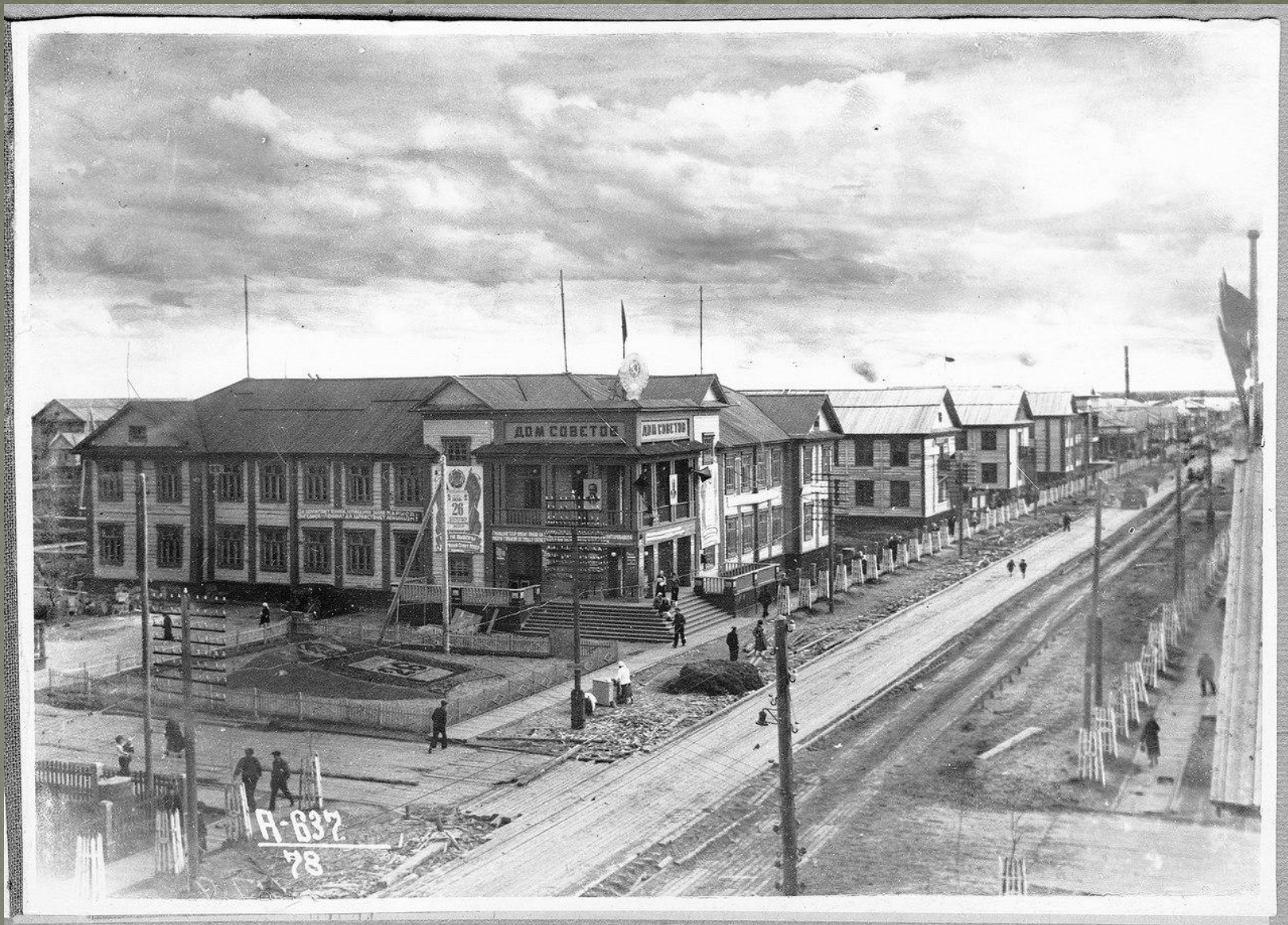
пр. БЕЛОМОРСКИЙ В ПРОШЛОМ