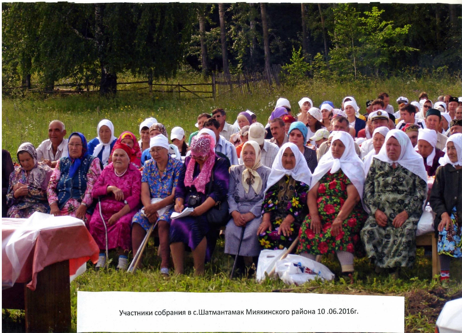
Участники собрания в с.Шатмантамак Миякинского района 10 .06.2016г.