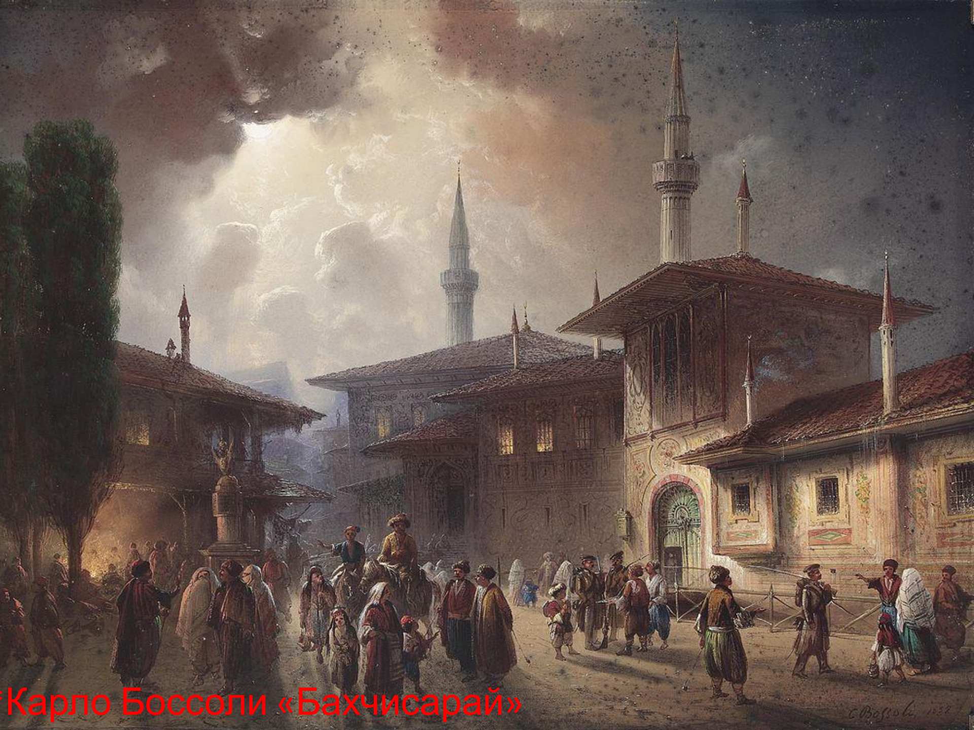
Карло Боссоли «Бахчисарай»