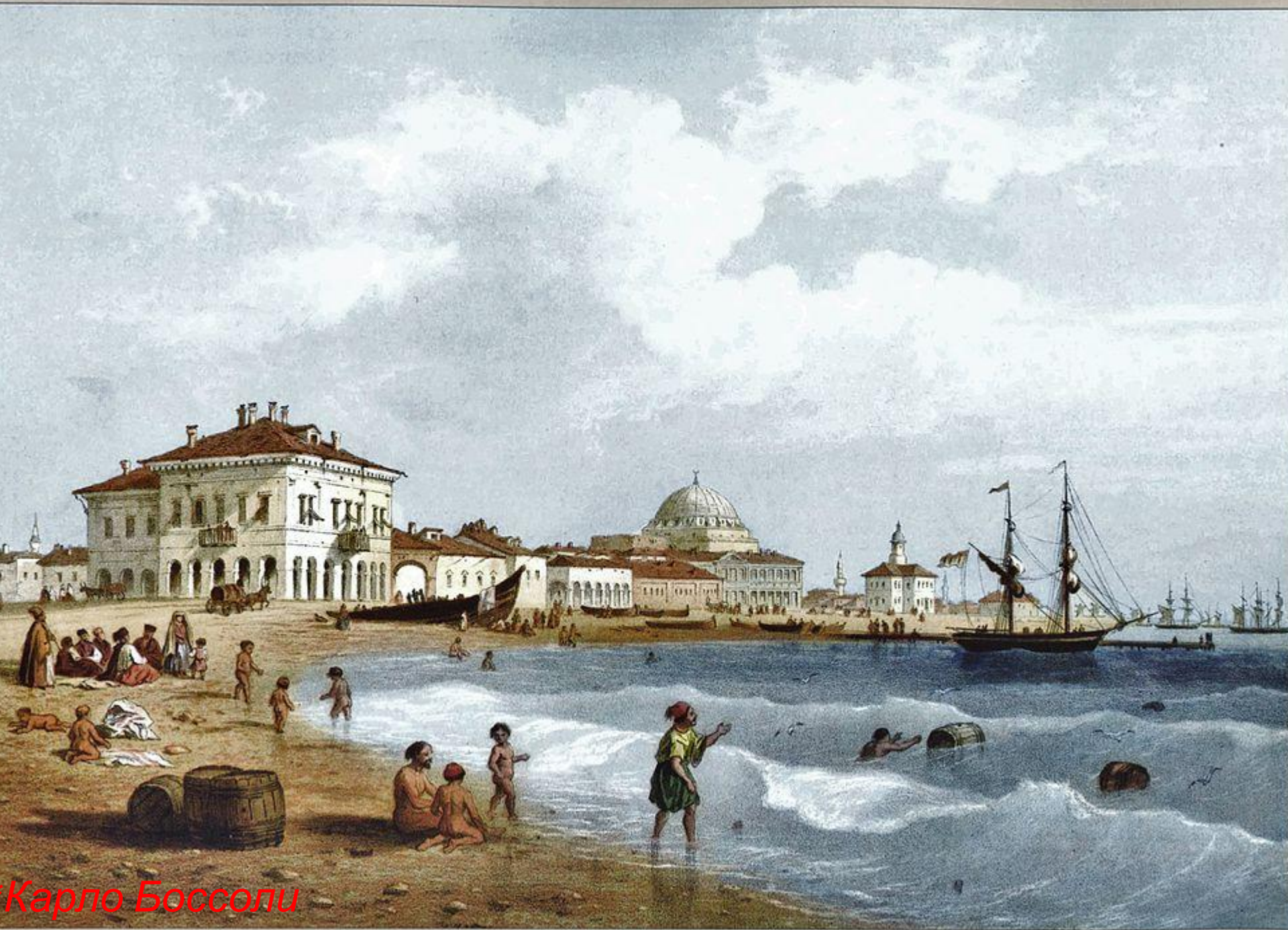
Карло Боссоли «Евпатория»