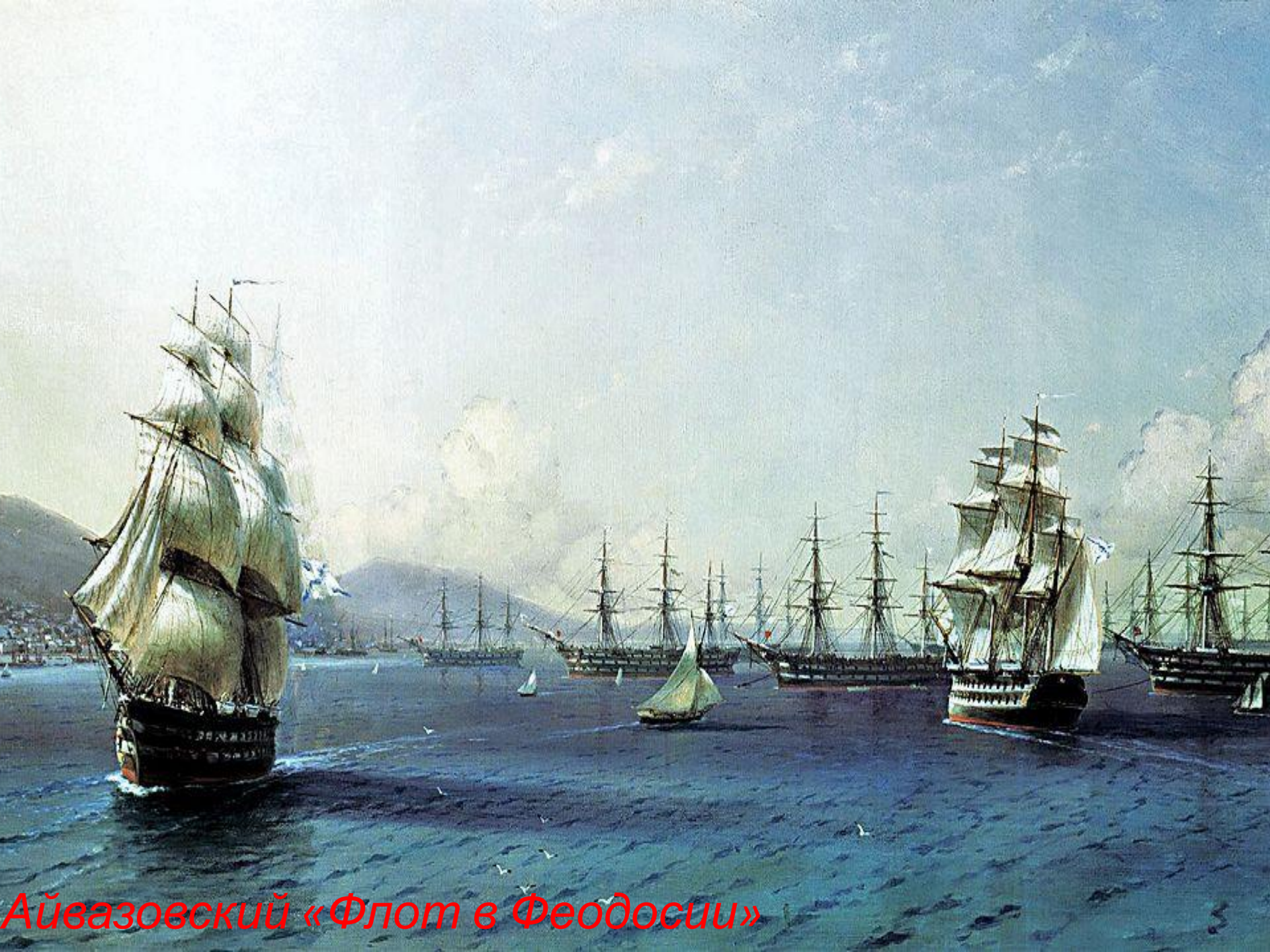
Айвазовский «Флот в Феодосии»