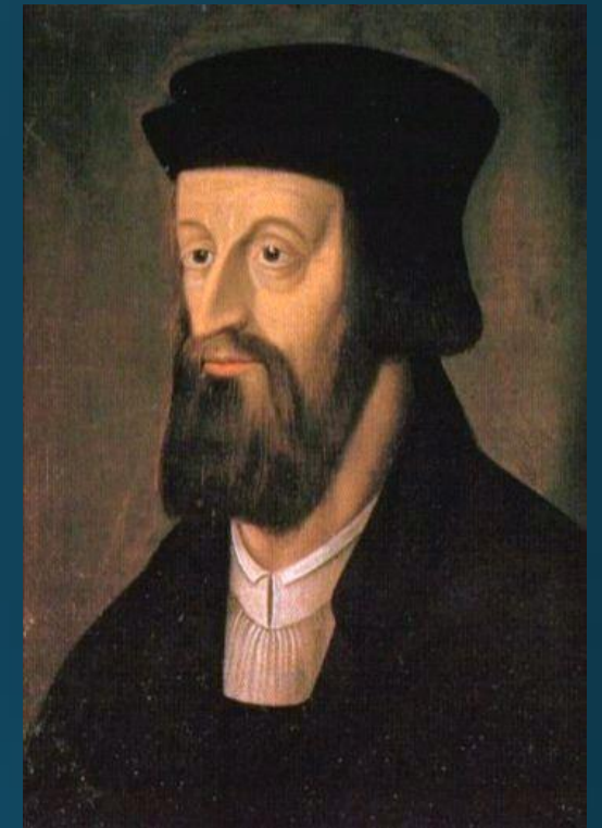
Ян Гус – профессор Пражского университета (1371-1415 гг.)