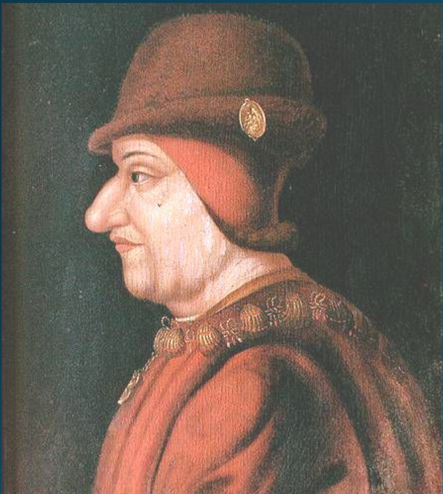
Людовик XI Благоразумный