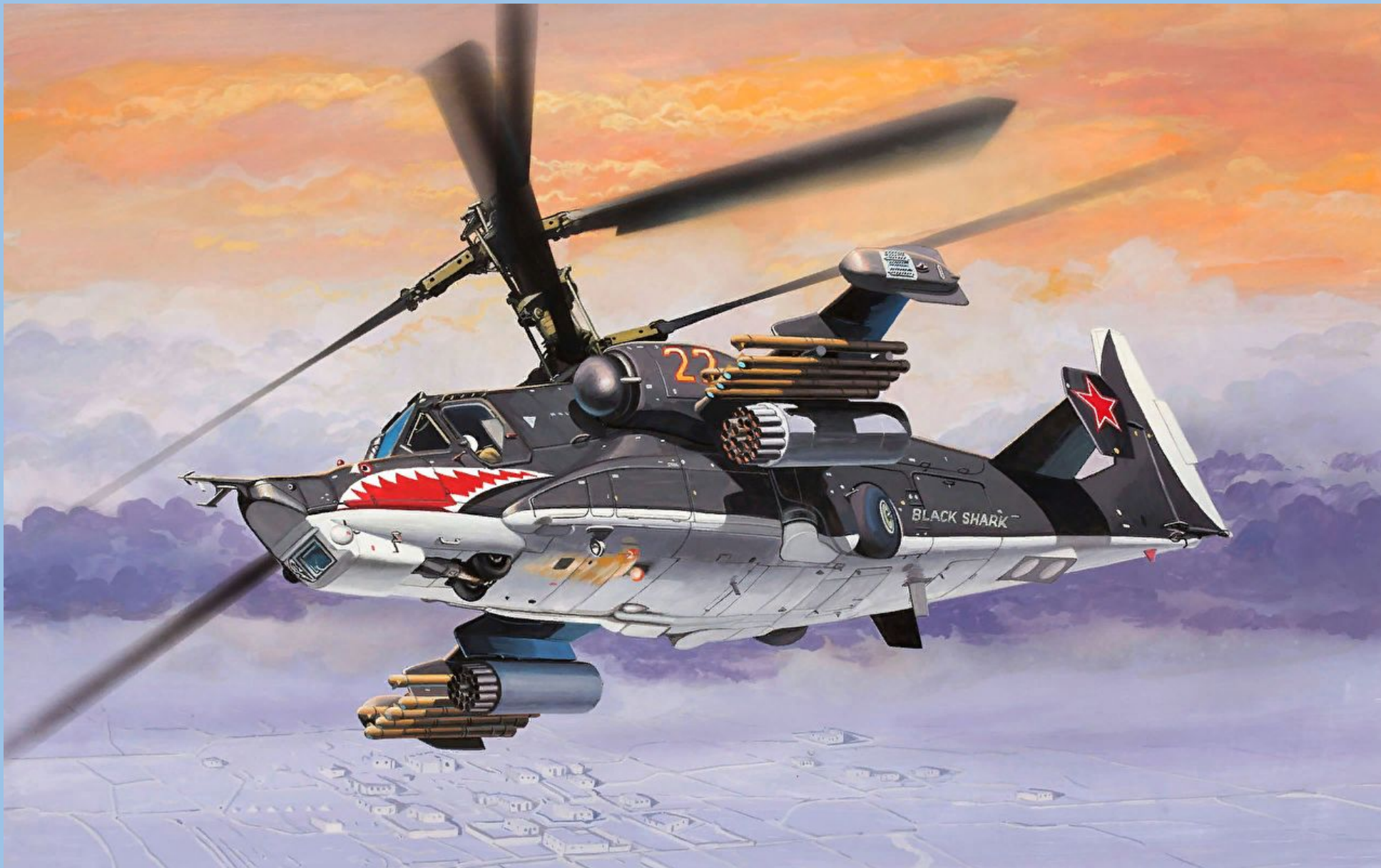
КА-50 «Черная акула»