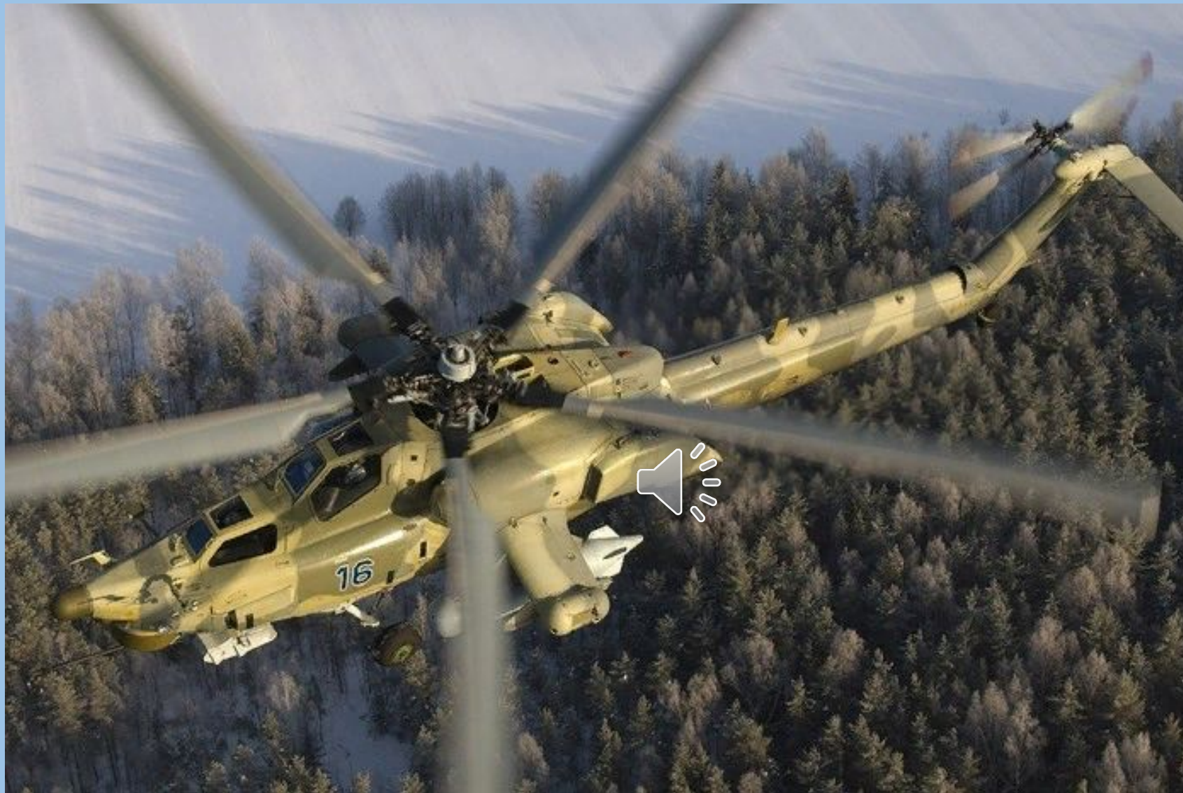
МИ-28Н «НОЧНОЙ ОХОТНИК»