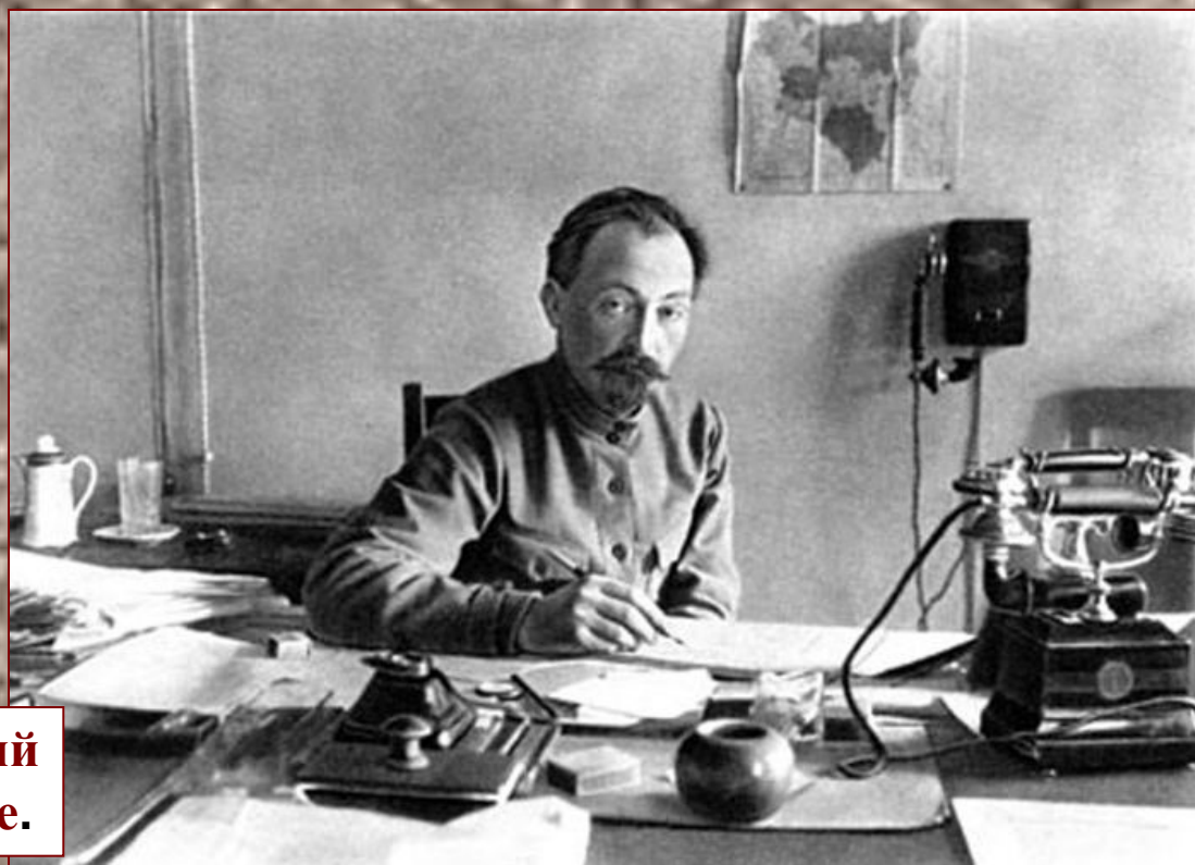
Ф.Э.Дзержинский на рабочем месте.

Всероссийская чрезвычайная комиссия (ВЧК) (для борьбы с саботажем и контрреволюцией) Возглавлял Ф.Э Дзержинский.