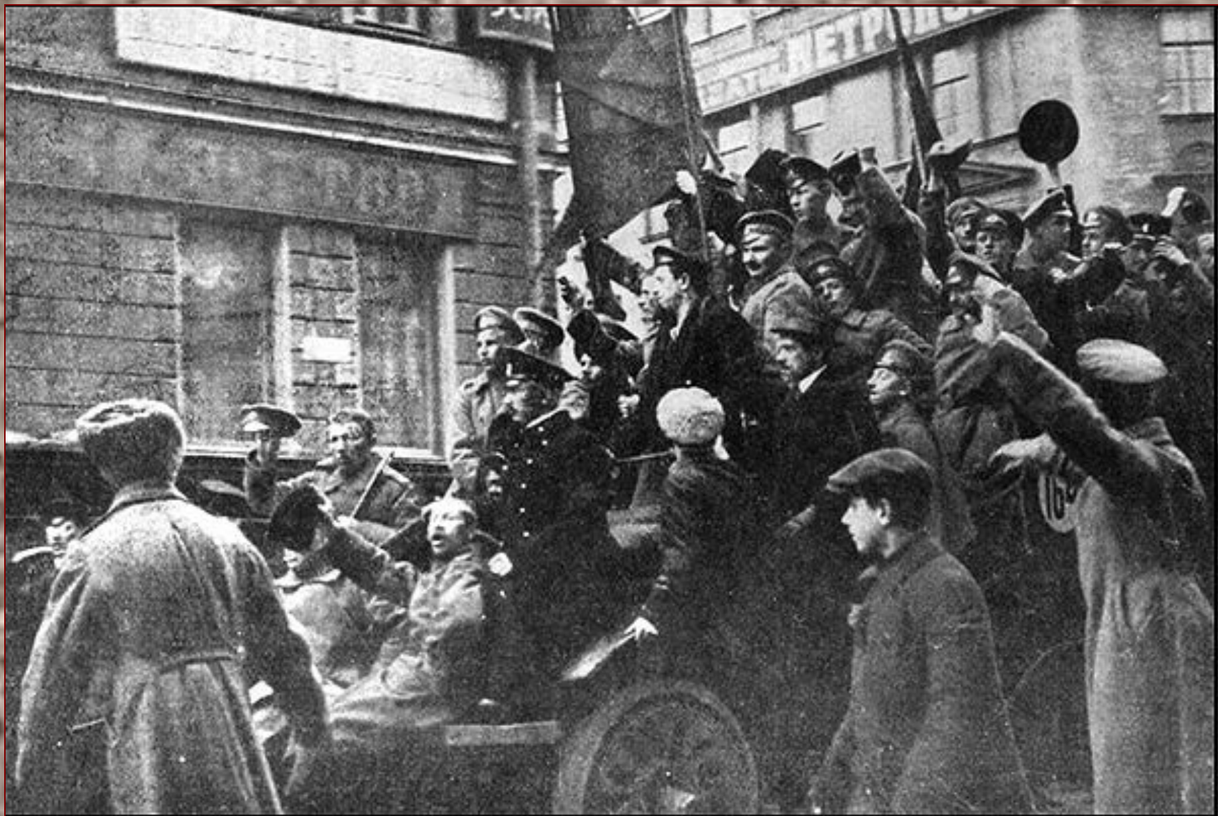
Грузовик с революционными солдатами в Петрограде, октябрь 1917 г.