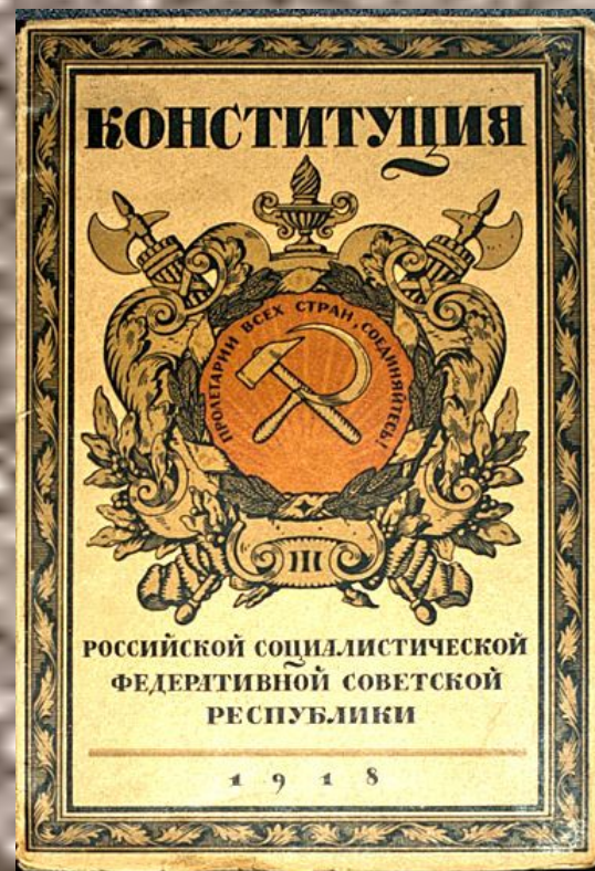
Первая конституция в России