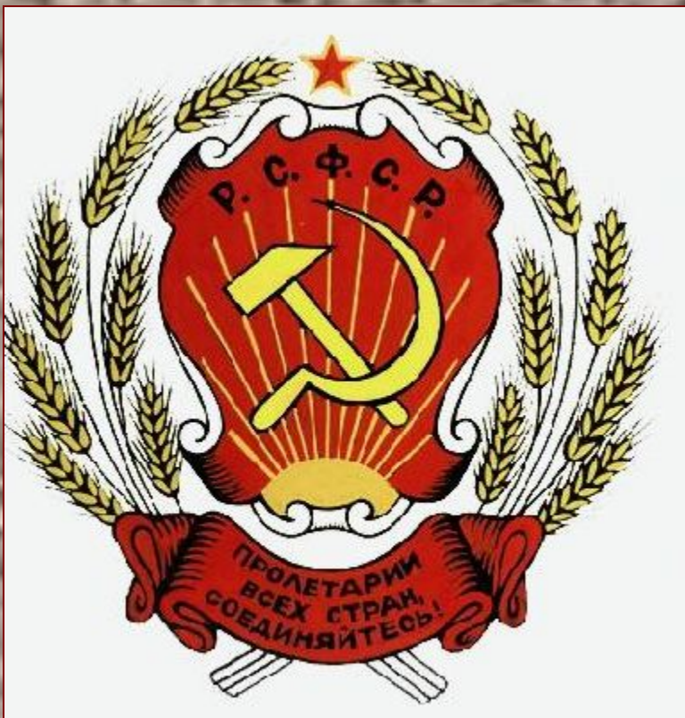
Герб РСФСР 1918 года