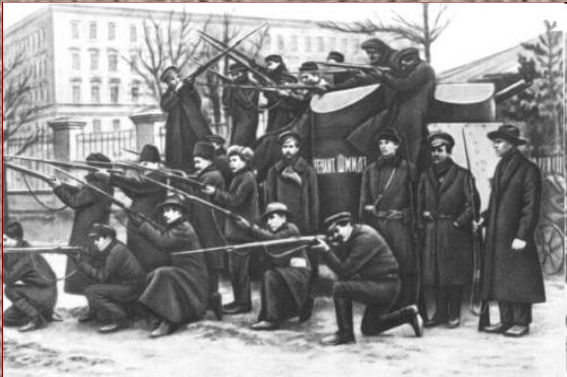
Красногвардейцы Путиловского завода. Петроград. Октябрь 1917.