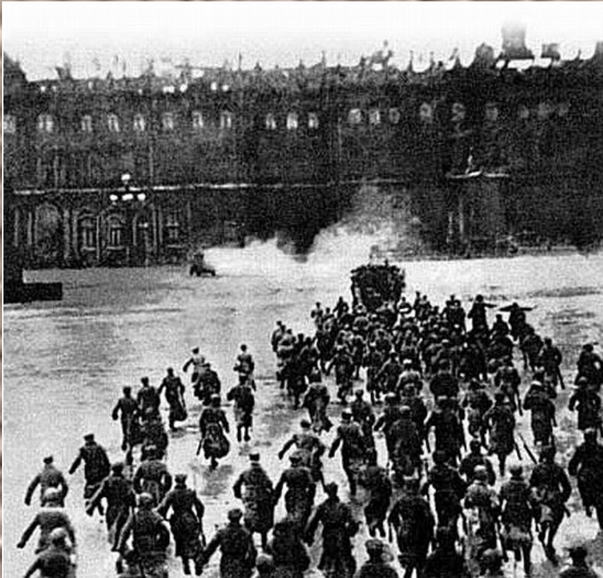
Взятие Зимнего дворца (инсценировка 1920 г.)

25-26 октября 1917 г. – II Всероссийский съезд Советов. Принятие первых декретов Советской власти.