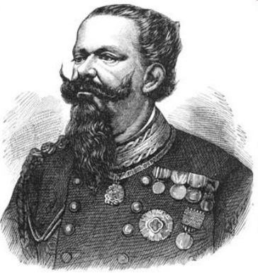
Виктор Эммануил II