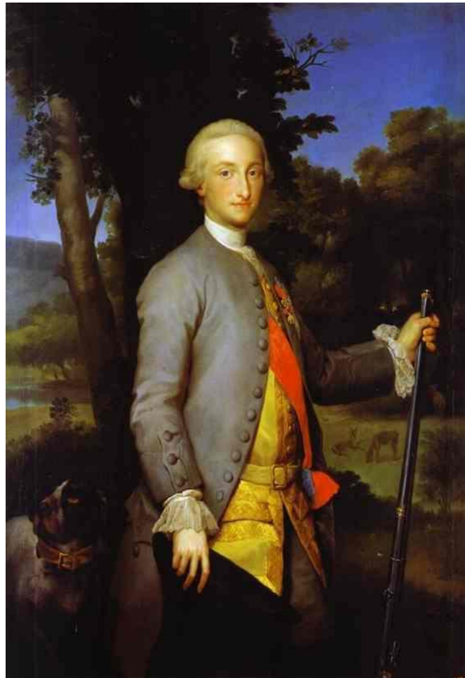
Принц Чарльз IV