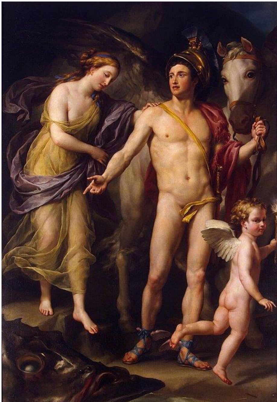
Персей и Андромеда, 1777