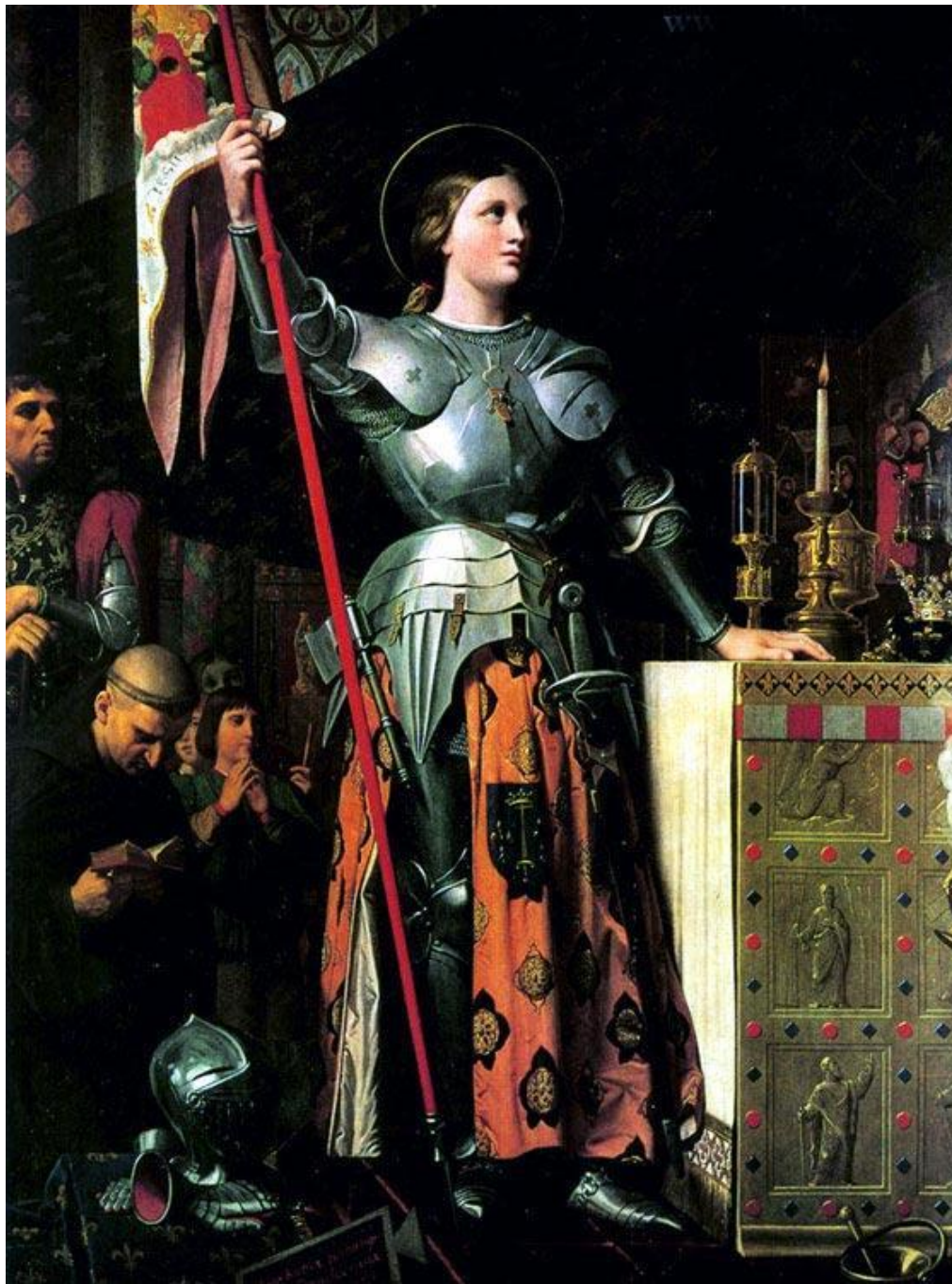
«Жанна д'Арк на коронации Карла VII», 1854