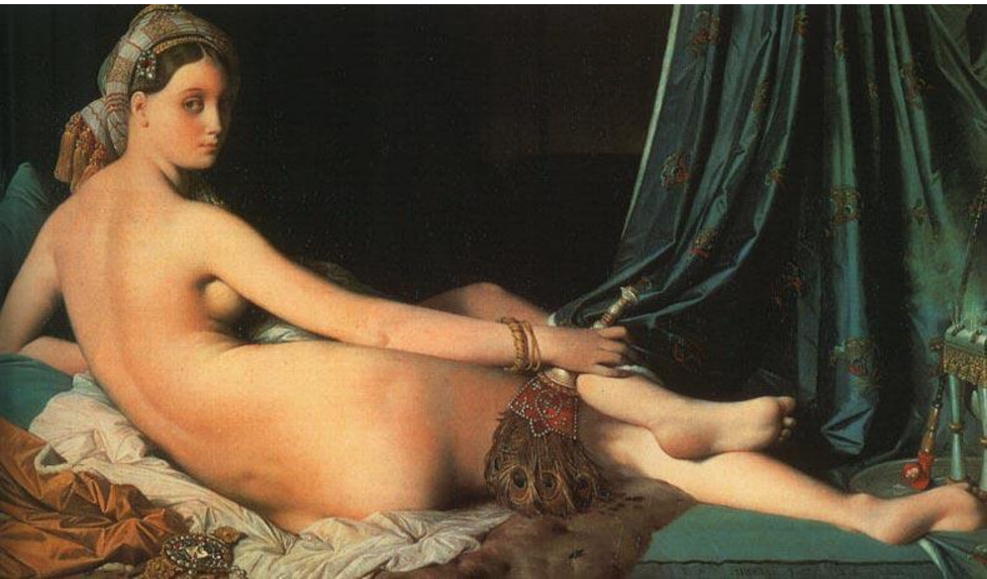
«Большая одалиска», 1814