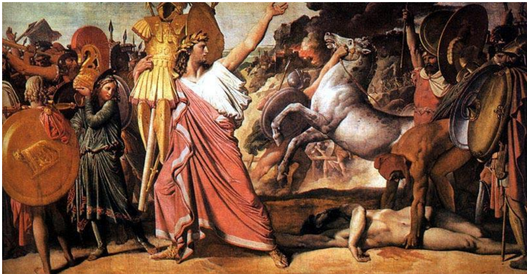
«Ромул - победитель Акрона», 1812

Жан Огюст Доминик Энгр (1780-1867), французский живописец и рисовальщик. С 1796 учился у Ж.Л.Давида в Париже. в 1806-1824 работал в Италии, где изучал искусство Возрождения и особенно творчество Рафаэля