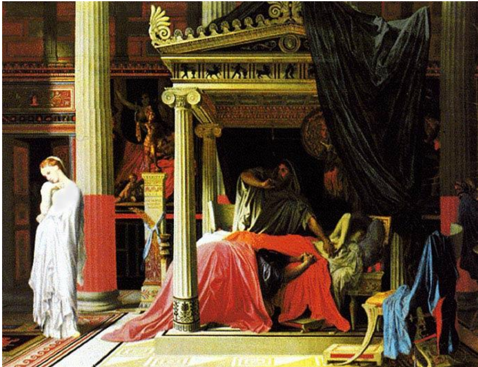
«Антиох и Стратоника», 1840

Энгр писал картины на литературные, мифологические, исторические сюжеты