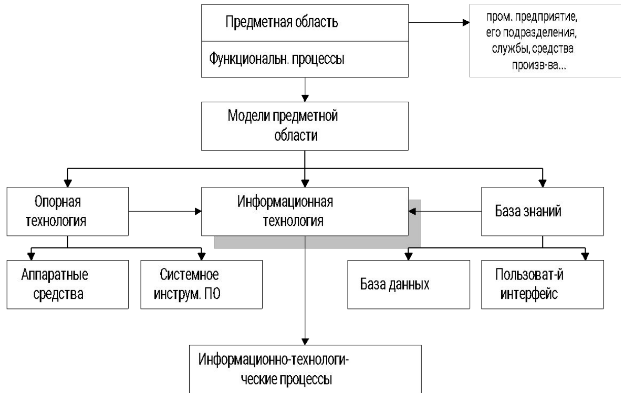
Рис. 1. 1. Структура информационной технологии.