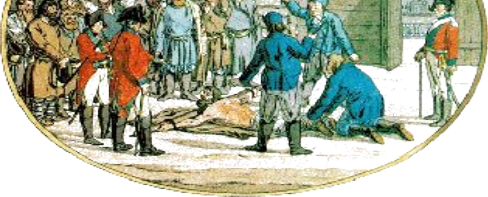
Наказание плетью в Тайной канцелярии (офорт конца XVIII в.)

Придя к власти, Анна ликвидировала Верховный тайный совет, заменив его Кабинетом министров, который, в сущности, управлял страной. Также была учреждена Канцелярия тайных розыскных дел, которая в короткий срок набрала огромную силу. Анна постоянно боялась заговоров, поэтому злоупотребления этого ведомства были велики.