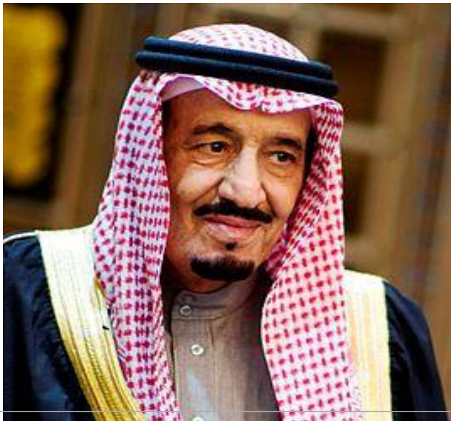
Король Саудовской Аравии Хранитель двух святынь