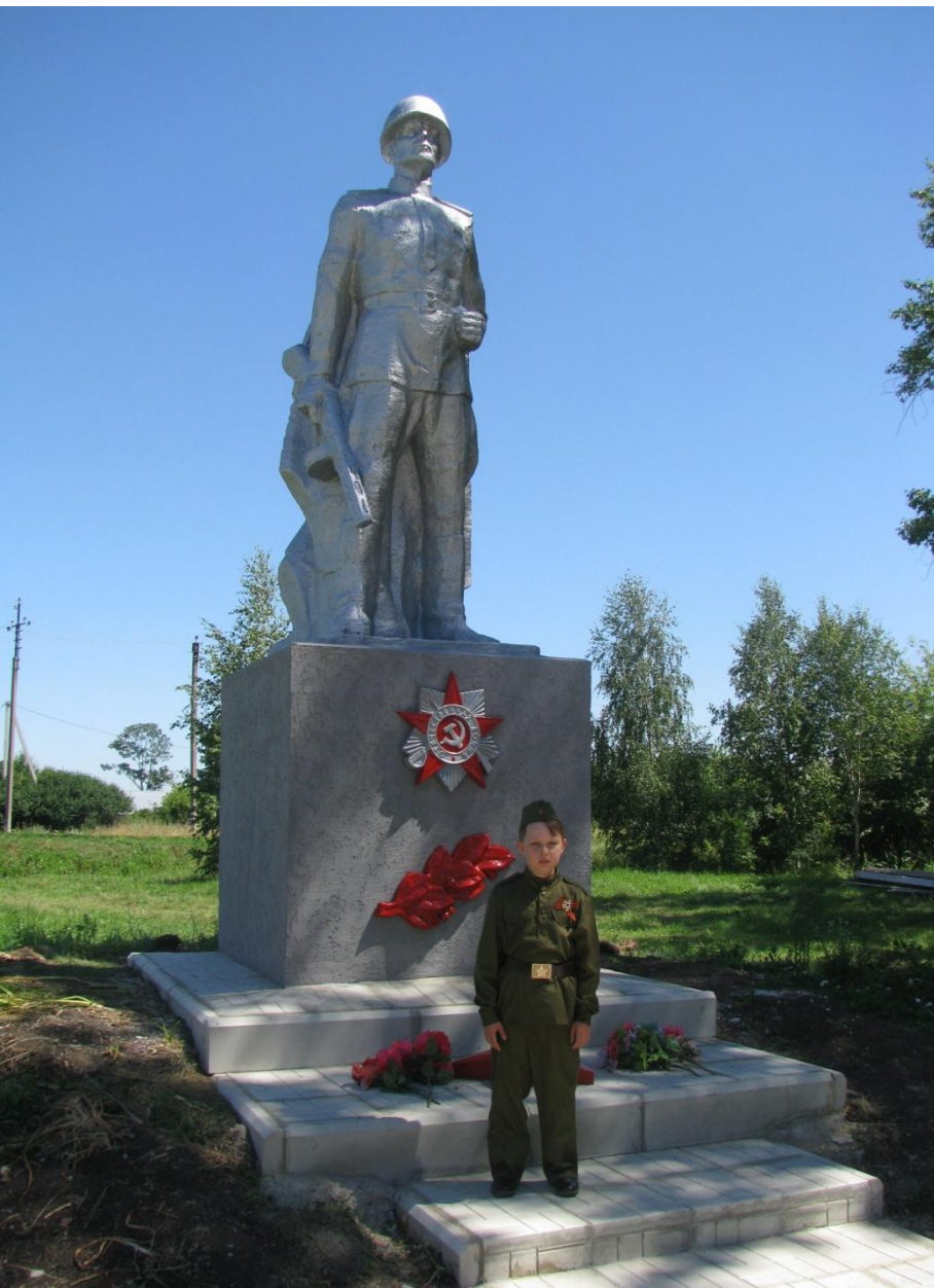
Памятник погибшим в годы Великой Отечественной войны в с. Высокое Башмаковского района Пензенской области.