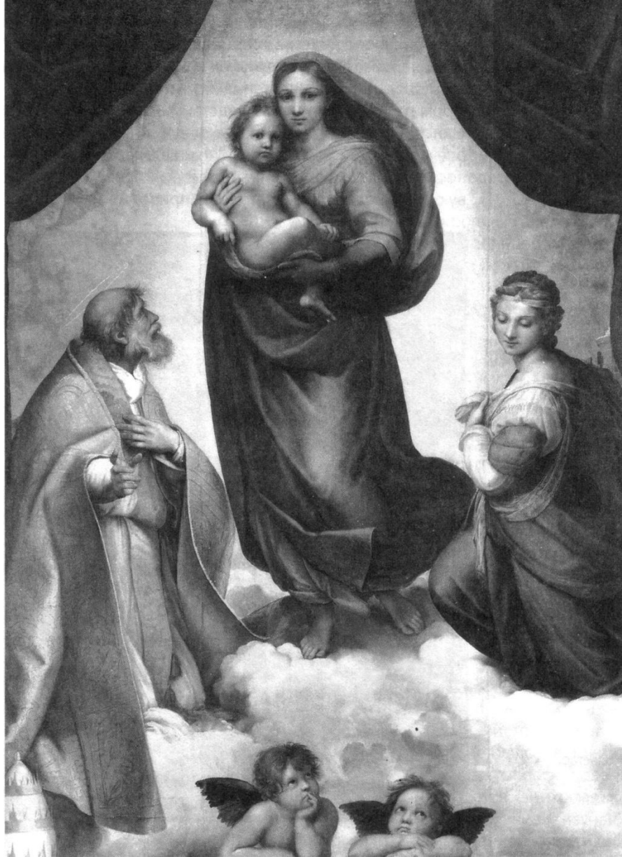
Рафаэль. «Сикстинская Мадонна»