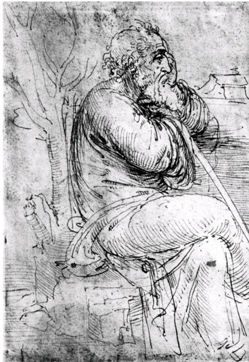
Леонардо. «Сидящий старик»