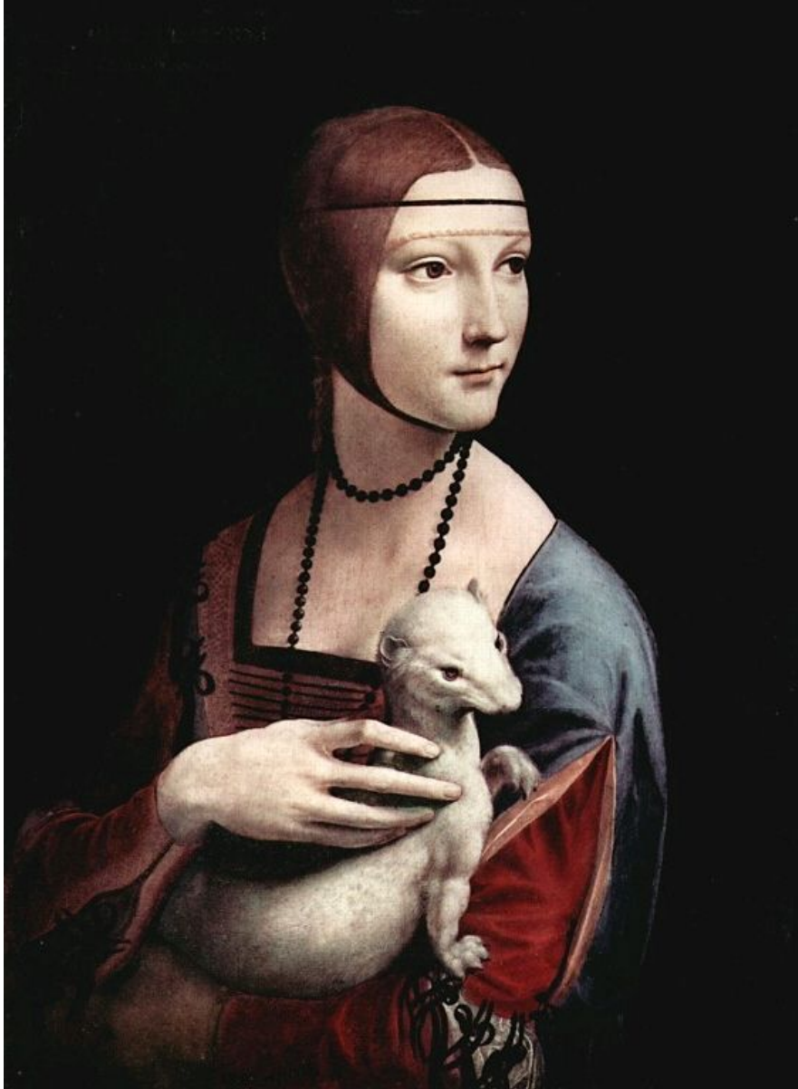
Леонардо. «Дама с горностаем»