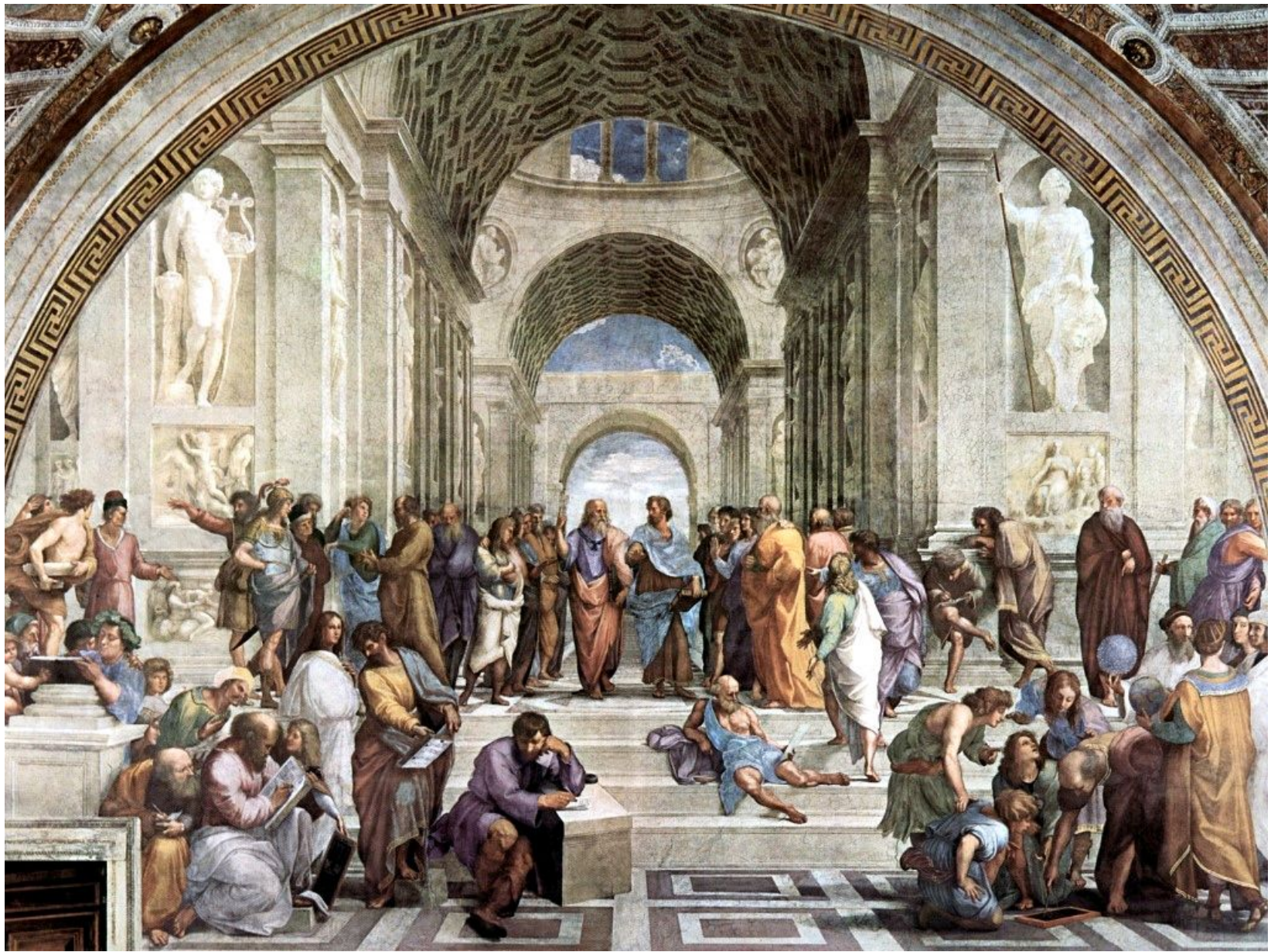
Рафаэль. Афинская школа