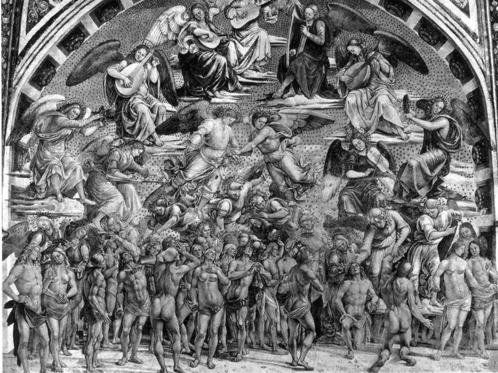
Лука Синьорелли. «Страшный суд»