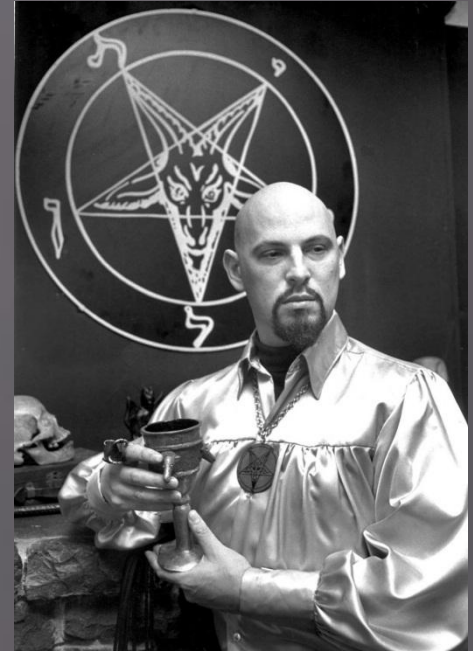
Антон Шандор Ла- Вей 1930 - 1997