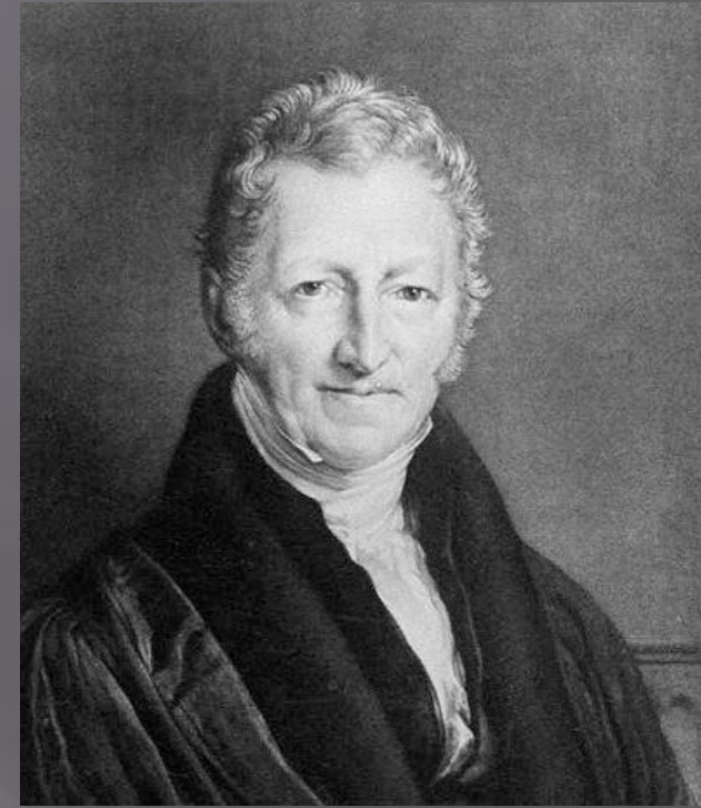
Томас Роберт Мальтус 1766 — 1834