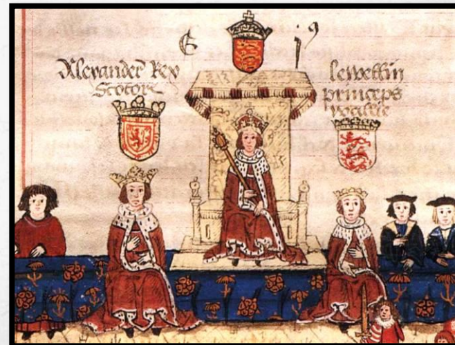
Король Эдуард I в парламенте, 1272 г.

Хотя войско Монфора потерпело поражение в гражданской войне и власть короля была восстановлена, короли и бароны продолжили созывать парламент.