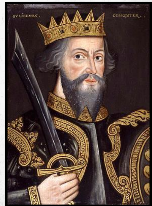
Вильгельм I Завоеватель

В 1066 г. умер король Англии Эдуард, не оставив наследников. Власть захватил представитель англосаксонской знати Гарольд. Вильгельм, находясь в родстве с английской династией, предъявил свои права на английский престол.