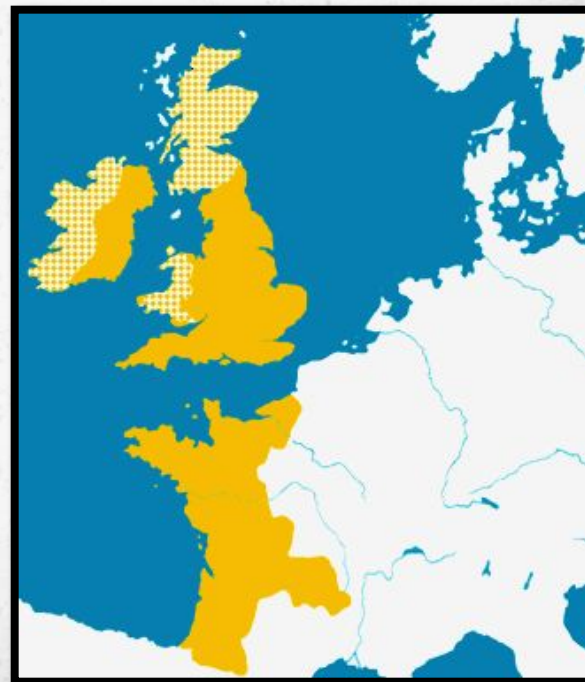
Держава Генриха II

Имея огромные владения во Франции и Англии, Генрих приложил все силы, чтобы подчинить государство своей власти. Он провел ряд важных государственных реформ.