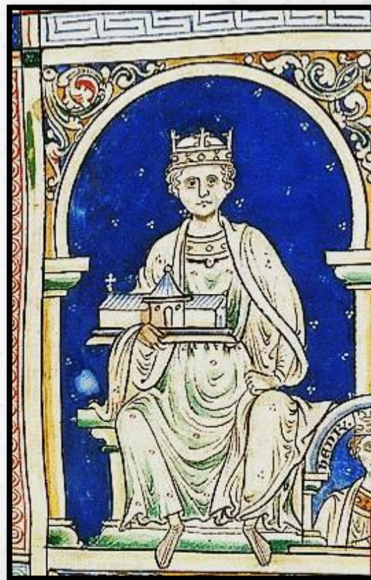
Генрих II Плантагенет (1154-1189) на миниатюре XII века

Опираясь на поддержку горожан и рыцарей, королевская власть одержала победу над крупными феодалами. В середине XII века в Англии утвердилась династия Плантагенетов, основателем которой стал Генрих II.