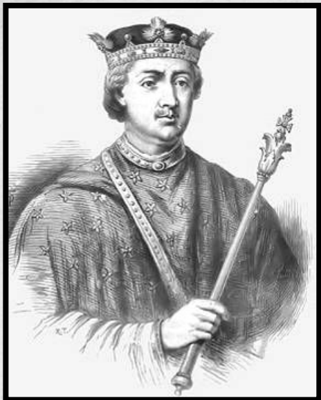
Генрих II в представлении художника начала XX века

Генрих II был коренастым, широкоплечим человеком, обладавшим резким и грубым голосом. Он имел переменчивый нрав: мог быть открытым, щедрым, но, когда гневался, превращался в злобного тирана. Генрих владел шестью языками, но не знал английского; имел редкую память и обширные знания. Небрежно одетый, умеренный в пище, безразличный к жизненным удобствам, он был неуютным в делах, полон энергии и решимости.