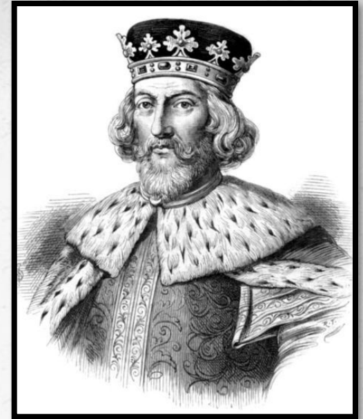
Иоанн Безземельный (1199-1216)

В 1199 году после смерти короля-реформатора Генриха II, королем стал его младший сын – Иоанн, получивший прозвище Безземельный за то, что проиграл войну французскому королю Филиппу II.