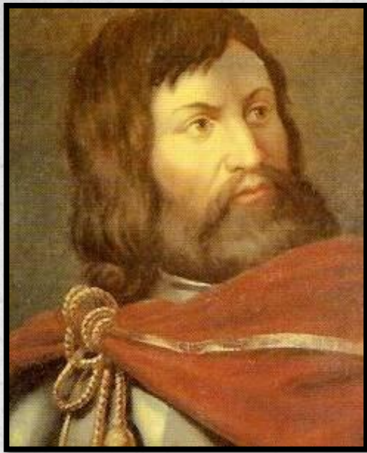
Граф Симон де Монфор

Симон де Монфор впервые созвал собрание представителей духовных и светских феодалов, рыцарей и горожан – парламент