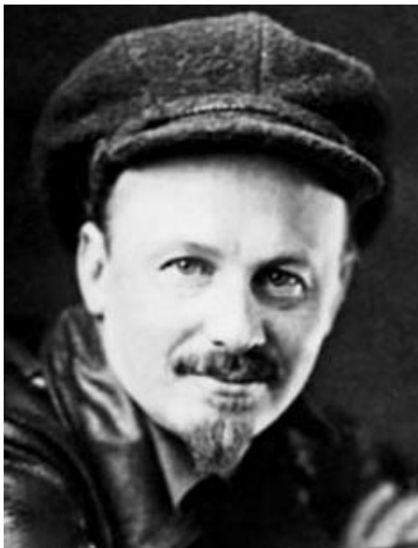
Богданов (Малиновский) А. А. (1873-1928)