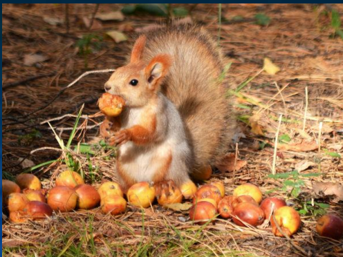
5. Белка делает запасы