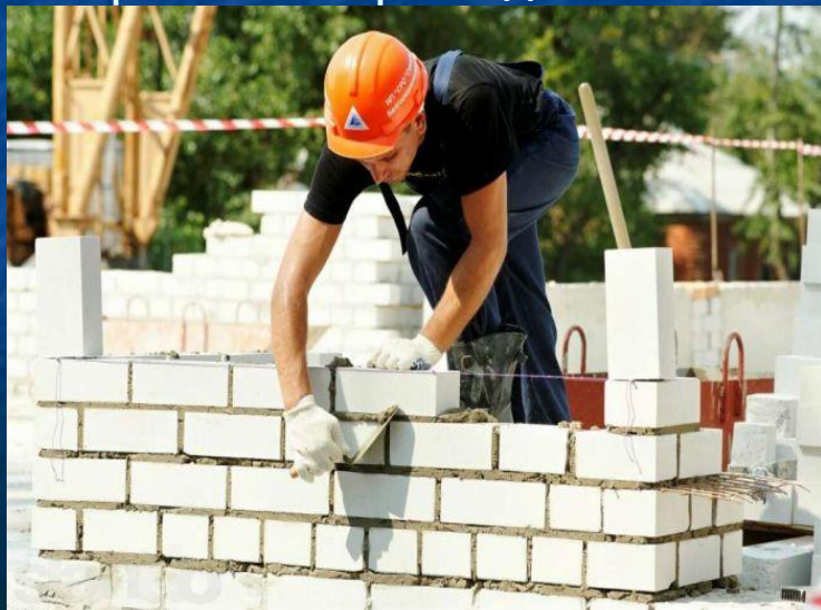
7. Строитель строит дом