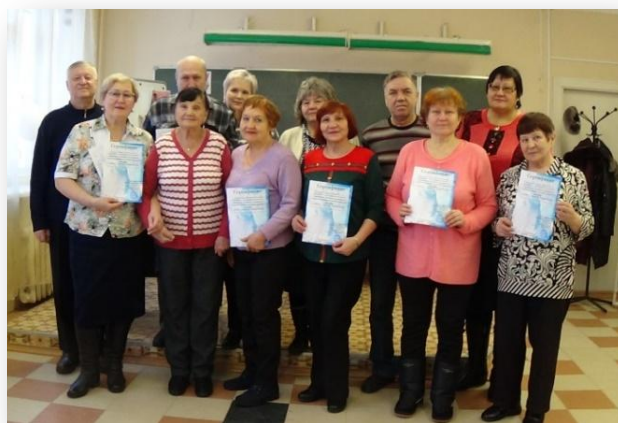
2019г Выпуск слушателей курса