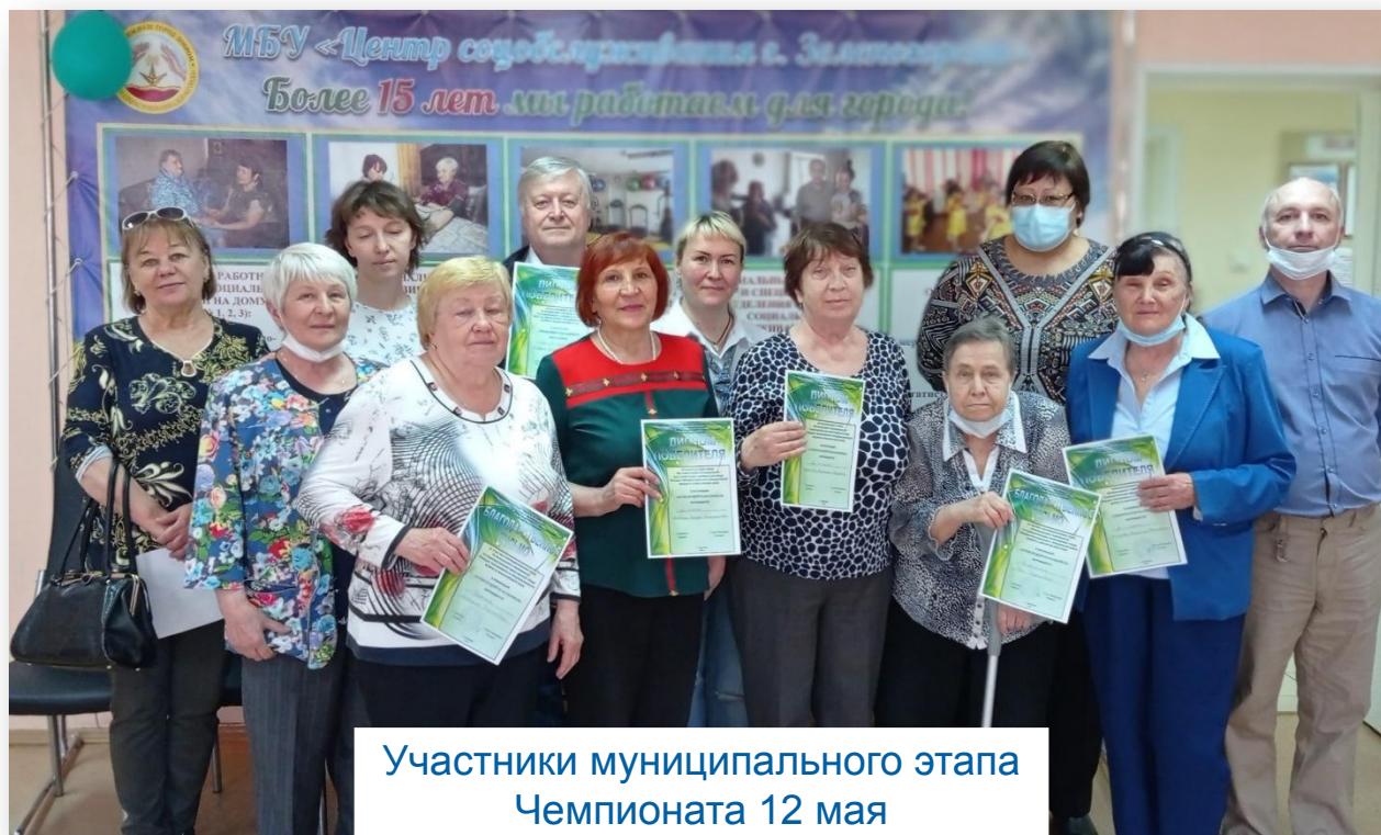
Участники муниципального этапа Чемпионата 12 мая

Кроме индивидуального и группового обучения пенсионеров цифровой грамотности, проведение конкурсов, чемпионатов, массовых мероприятий по плану клубов «Точка доступа...» и «РУНЕТ»