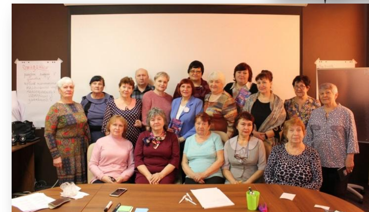
2020г День компьютерщика