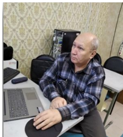
2019г участник финального этапа X Чемпионата