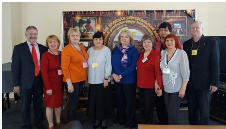
2018г Участники Регионального чемпионата