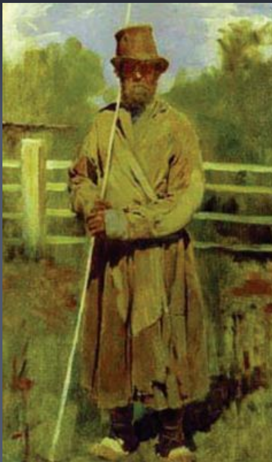
В. Васнецов. Крестьянин с шестом.