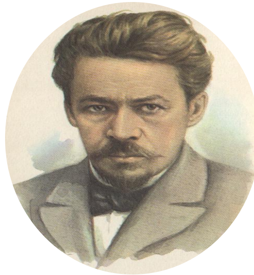
А.С.Аренский (теория музыки и композиции)