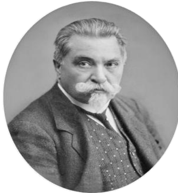
В.И.Сафонова (камерный ансамбль)