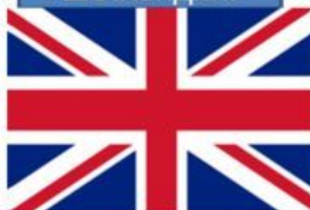
Флаг Северной Ирландии.