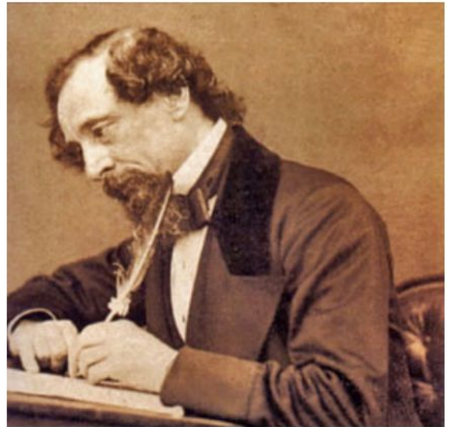
Чарльз Диккенс (07.02.1812 – 09.06.1870)