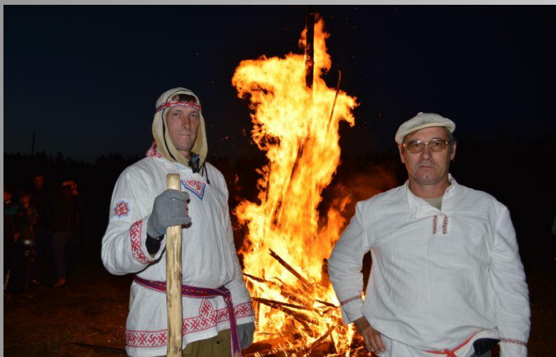
Б ольшой Купальский костёр Ш турм снежной крепости на Комоедицу