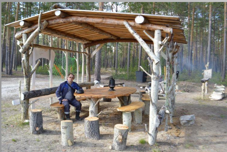
Воплощение творческих идей