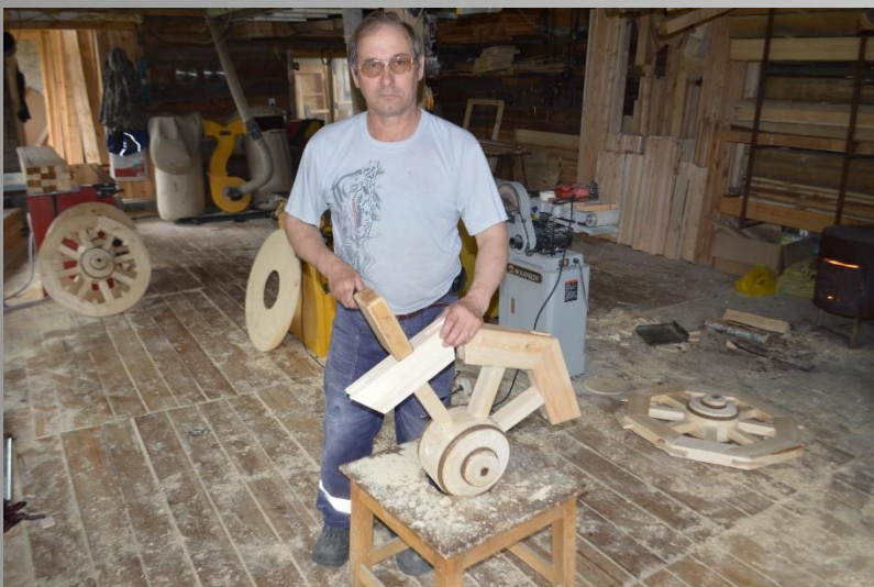
Т ворческий процесс