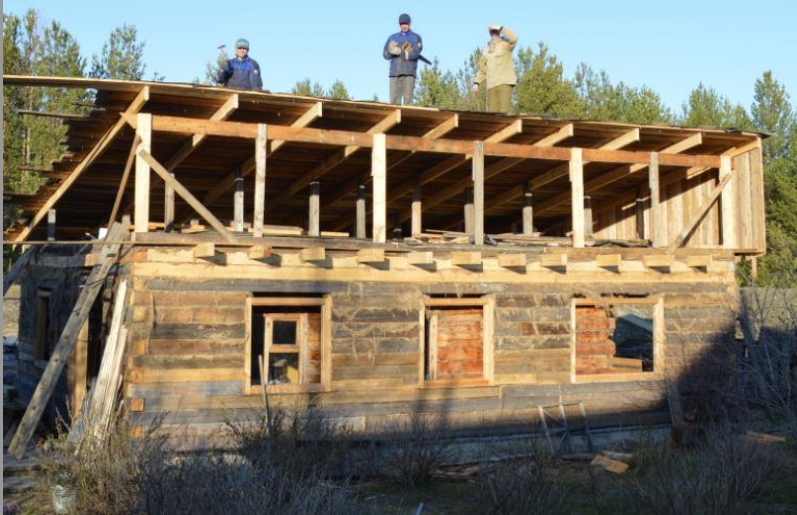
Мастерская снаружи и внутри