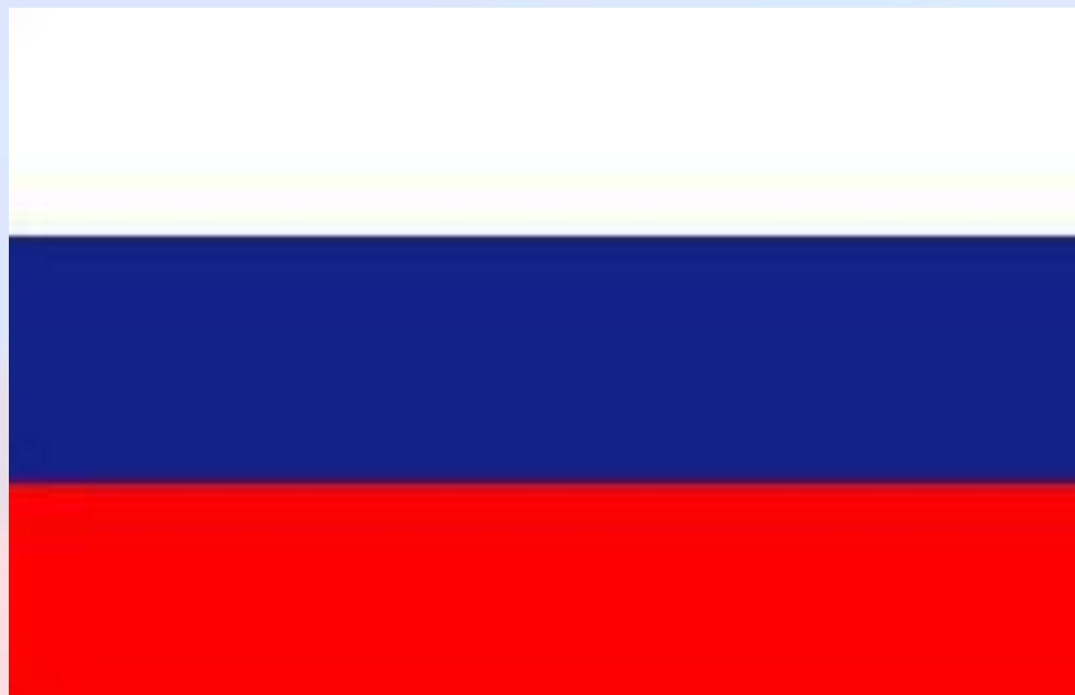
Флаг образца 1991 года

22 августа 1991 года государственным флагом России было признано полотнище с бело-сине-красной горизонтальными полосами.