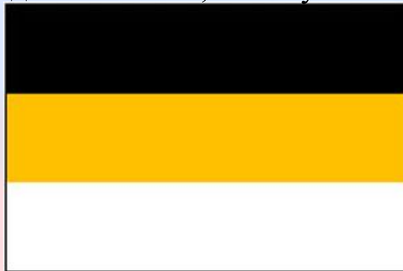
Флаг образца 1858 года

В 1858 г. Александр II осуществил реформу в обращении с государственными символами с целью упрочения монархии. Среди прочих преобразований Царь-Освободитель установил, что все знамена, флаги и другие атрибуты, необходимые на торжествах, должны быть изготовлены в государственных цветах, которые расположены в определенном порядке: сверху черная полоса, посередине - желтая, а снизу - белая.