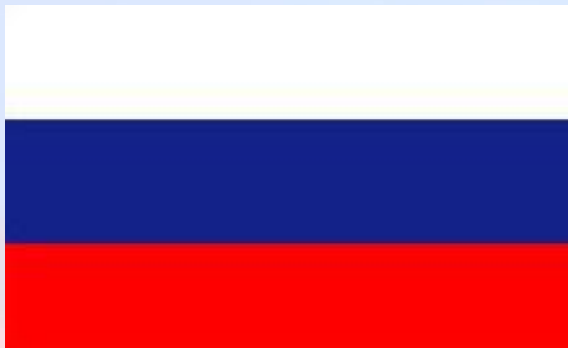
Флаг образца 1705 года

В 1705 году Петр I издал указ о размещении бело-сине-красного флага на торговых судах, который также использовался как военно-полевой флаг русской армии.