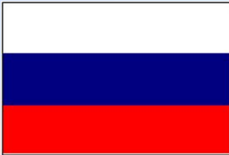
Флаг образца 1896 года

В 1896 году накануне коронации Николая II петровскому триколору был официально присвоен статус государственного флага.