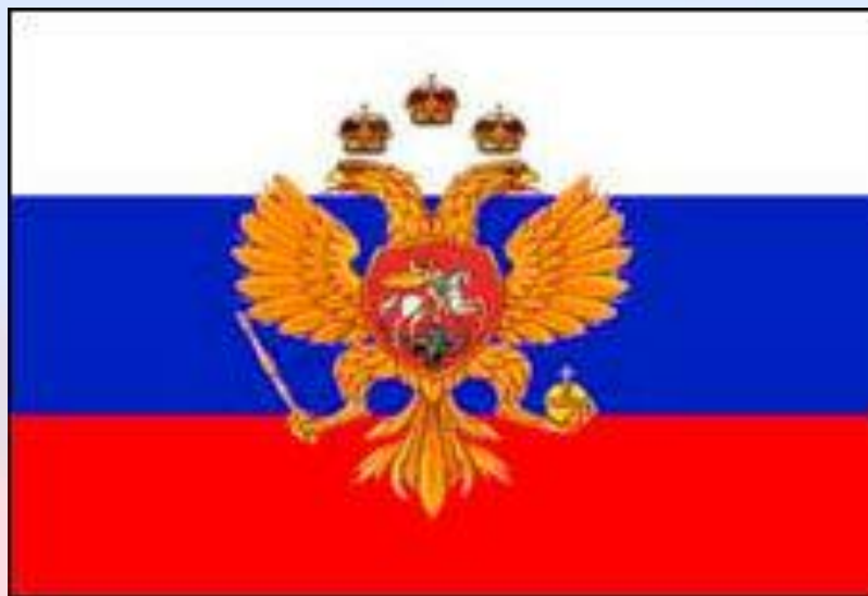
Флаг образца 1693 года

В 1693 году Петр I использовал «флаг царя Московского». Флаг состоял из трех горизонтальных полос, по центру флага был расположен золотой двуглавый орел. Именно тогда у флота появился свой единый флаг, который можно считать государственным флагом России.