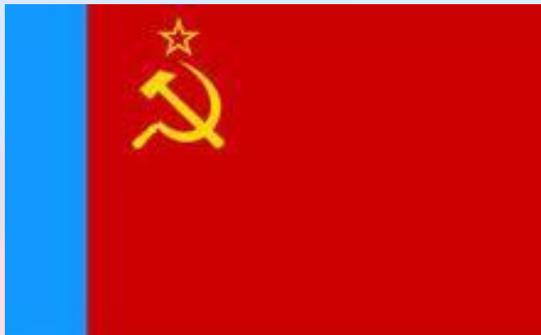
Флаг образца 1954 года

Окончательный вариант флага СССР был утвержден второго мая 1954 года. Теперь флаг состоял из красного полотнища со светло-синей полосой у древка во всю ширину флага. На красном полотнище, в левом верхнем углу, были изображены золотые серп и молот, с пятиконечной звездой над ними.